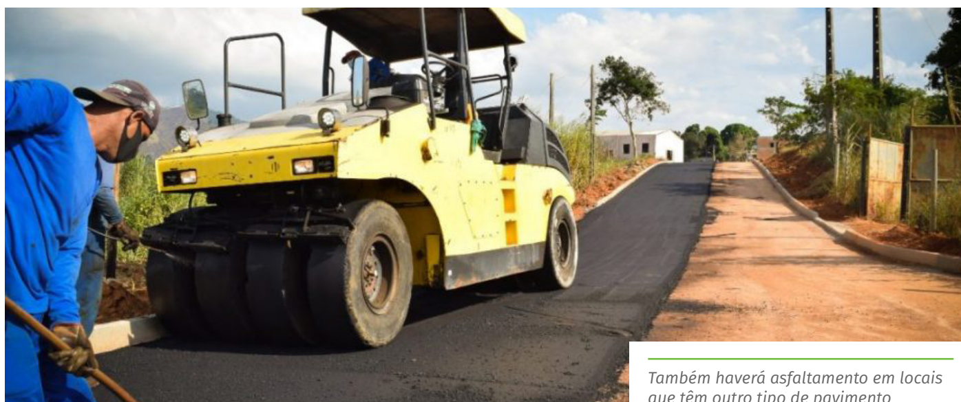
Também haverá asfaltamento em locais que têm outro tipo de pavimento

Rua Manoel Braga Machado – Ferroviários Rua Sebastião Carreiro – Jardim Itapemirim Rua Colatina – Zumbi Rua Vera Margarida Cruz Lucas – Basileia Rua Carlindo Santana – Basileia Rua Virgílio Rosa Vieira – Basileia Rua Marcondes Borges Moraes – Zumbi/Alto Eucalipto Rua Vilarino Pires de Almeida – São Lucas Rua Eduardo Cardoso – Baiminas Rua Mem de Sá – Baiminas Rua Demóstenes Gomes Alves – Ibitiquara