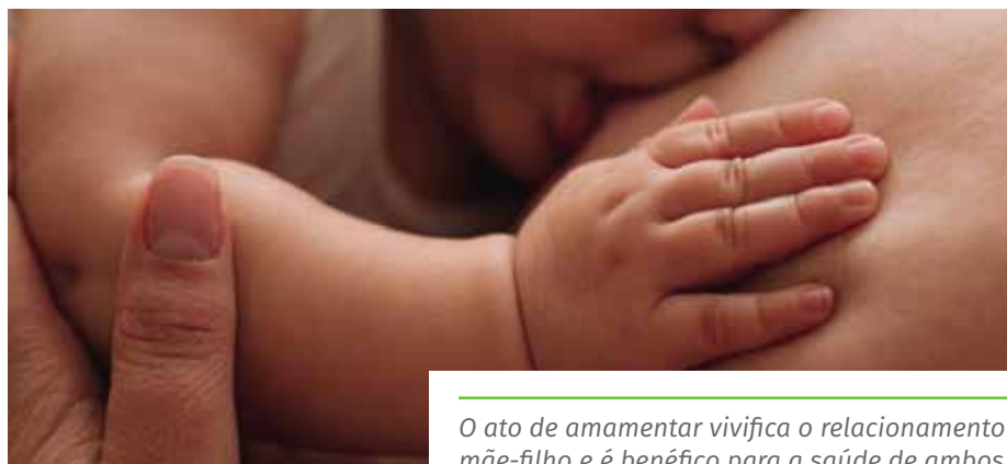
O ato de amamentar vivifica o relacionamento mãe-filho e é benéfico para a saúde de ambos

Gestantes e mães recentes que queiram participar das atividades do Agosto Dourado só precisam procurar a UBS mais próxima de casa para se informar sobre a programação.