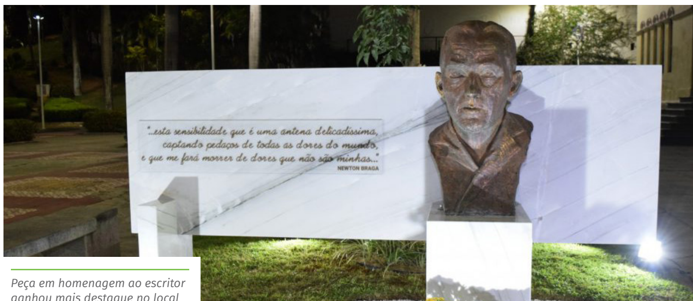
Peça em homenagem ao escritor ganhou mais destaque no local

Em 1932, voltou para a cidade natal, onde foi jogador do Estrela do Norte e redator-chefe do Correio do Sul, que o ajudou a impulsionar movimentos cívicos, como a criação do Dia de Cachoeiro. “Lirismo perdido”, “Cidade do interior” e “Poesias e prosa” são algumas de suas principais obras.