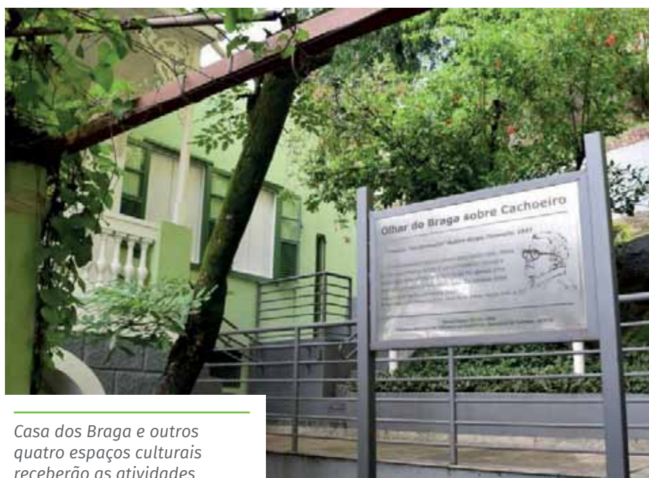
Casa dos Braga e outros quatro espaços culturais receberão as atividades

O Programa de Promoção e Assistência Social – Casa Verde realizará oficina de musicalização infantil com flauta doce para crianças de 7 a 12 anos, na Casa de Cultura Roberto Carlos, que fica no bairro Recanto. As aulas serão híbridas e as presenciais acontecerão às segundas e quartas, das 7h às 9h e das 13h às 15h. Mais informações: 99981-2947.