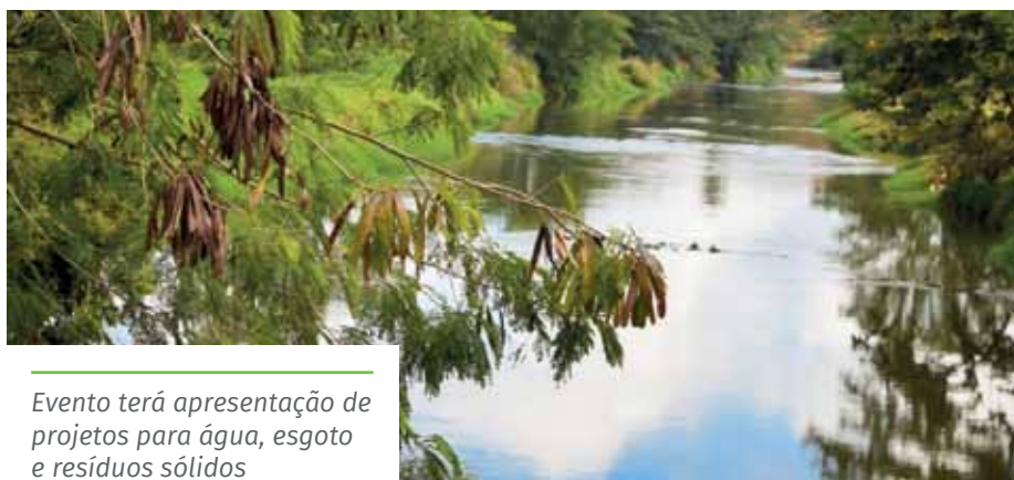
Evento terá apresentação de projetos para água, esgoto e resíduos sólidos

Os documentos referentes ao PMAE/PMGIRS podem ser conferidos na página da Semma no portal da Prefeitura ( www.cachoeiro.es.gov.br ), na aba “Plano Municipal de Água e Esgoto e Gestão Integrada de Resíduos Sólidos”.