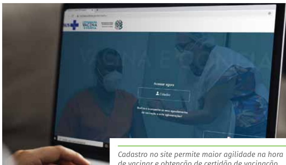
Cadastro no site permite maior agilidade na hora de vacinar e obtenção de certidão de vacinação