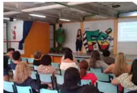
Participaram da formação 140 manipuladoras de alimentos, divididas em quatro grupos

Para garantir a segurança sanitária, as escolas seguem, rigorosamente, os protocolos de saúde, controlando a ocupação dos espaços físicos e estabelecendo horários escalonados para os intervalos e refeições.