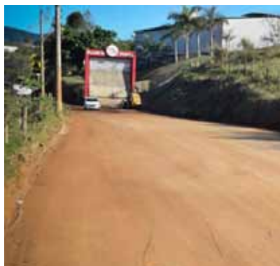
Local estava bastante danificado; obra beneficia empresas e moradores do distrito