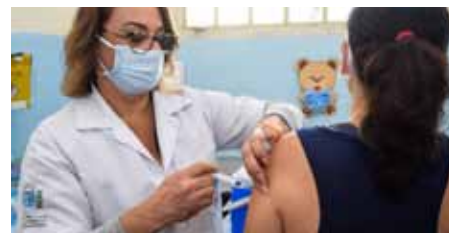
Na semana que vem, outra faixa etária deverá ser contemplada com a vacinação em Cachoeiro

Confira a lista de Unidades Básicas de Saúde para se vacinar (50 a 59 anos), no link: www.cachoeiro.es.gov.br/noticias