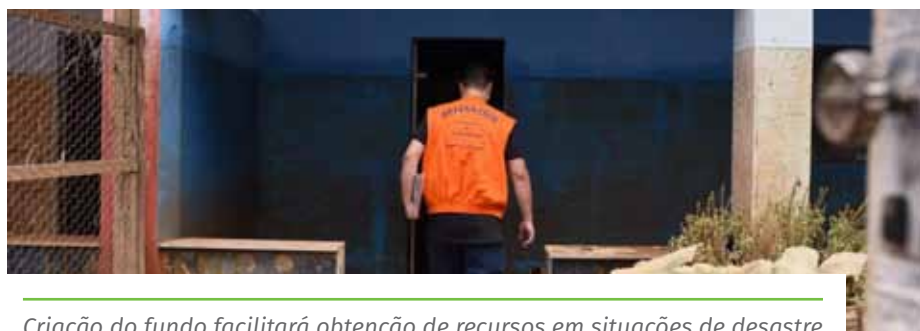
Criação do fundo facilitará obtenção de recursos em situações de desastre