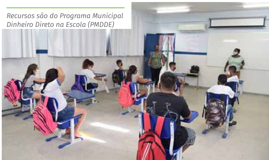
Recursos são do Programa Municipal Dinheiro Direto na Escola (PMDDE)

A portaria 588/2021, que dispõe sobre o repasse dos recursos, foi publicada na edição desta terça-feira (15) do Diário Oficial do Município, disponível no site www.cachoeiro.es.gov.br/diario .