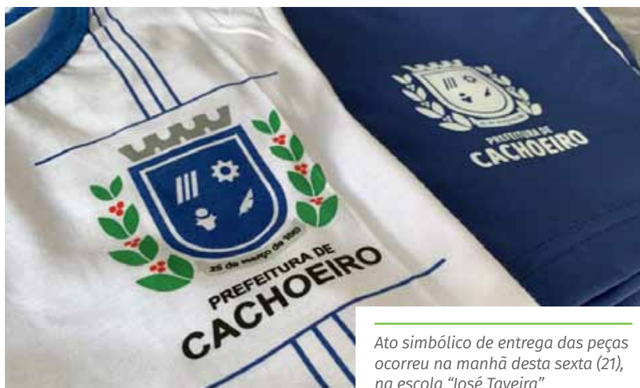
Ato simbólico de entrega das peças ocorreu na manhã desta sexta (21), na escola “José Taveira”