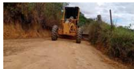
Os trabalhos foram realizados pela Secretaria Municipal de Interior

Nesta semana, a Secretaria de Interior dará continuidade aos serviços nas estradas das localidades de Soturno, Sambra e Gironda.