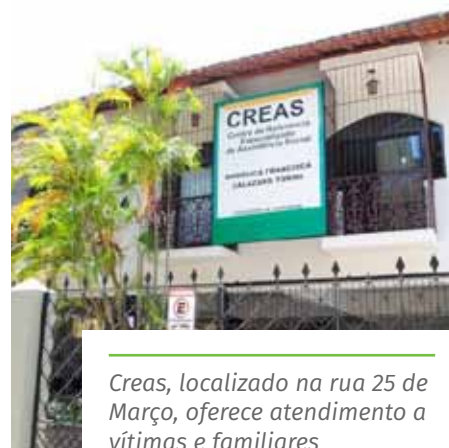
Creas, localizado na rua 25 de Março, oferece atendimento a vítimas e familiares

Confira os canais de atendimento, no link: www.cachoeiro.es.gov.br/noticias