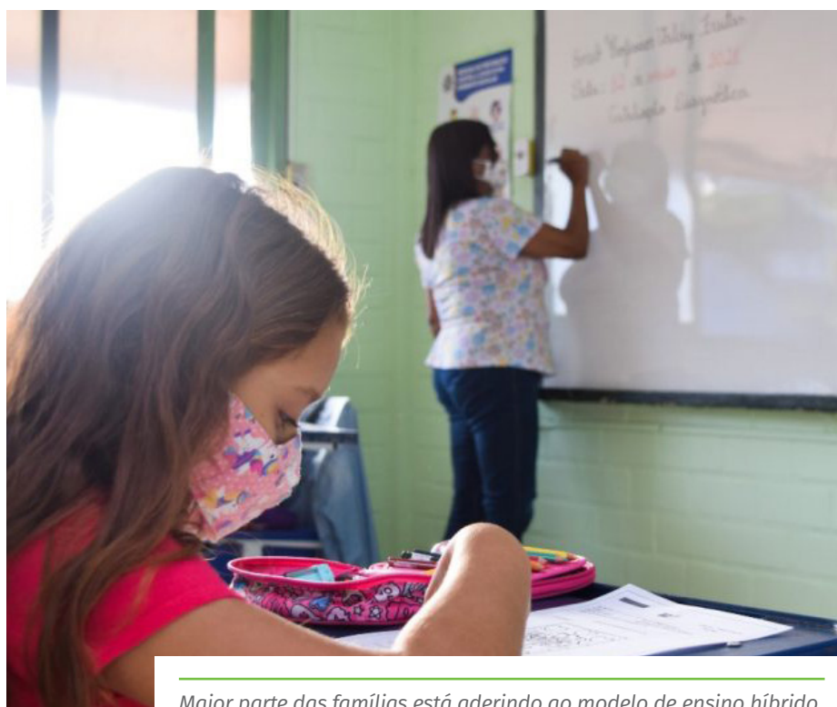
Maior parte das famílias está aderindo ao modelo de ensino híbrido

No caso de estudantes que não possuem acesso à internet, os pais e responsáveis podem entrar em contato com as escolas para retirar o material impresso diretamente nas unidades.