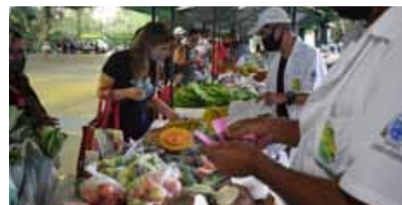
Feira ocorre todas as terças e sextas, das 17h às 19h, no Pavilhão da Ilha da Luz

Bairro Nova Brasília – Próximo ao ginásio municipal – a partir das 5h.