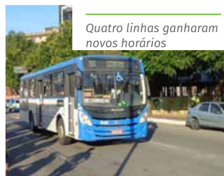
Quatro linhas ganharam novos horários

A Agersa ressalta também que, para registrar reclamações sobre o serviço de transporte, o requerente pode entrar em contato com a Ouvidoria da autarquia pelo telefone 0800 283 4048, por meio do aplicativo “Todos Juntos”, da Prefeitura, ou pelo site www.agersa.es.gov.br .