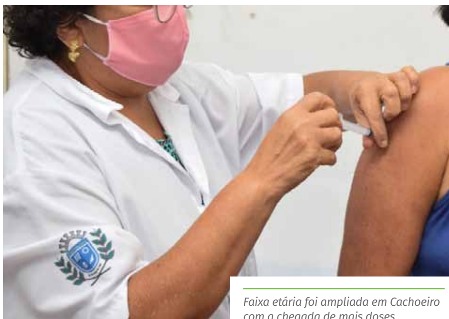
Faixa etária foi ampliada em Cachoeiro com a chegada de mais doses

Confira os contatos das Unidades Básicas de Saúde completa, no link: www.cachoeiro.es.gov.br/noticias .