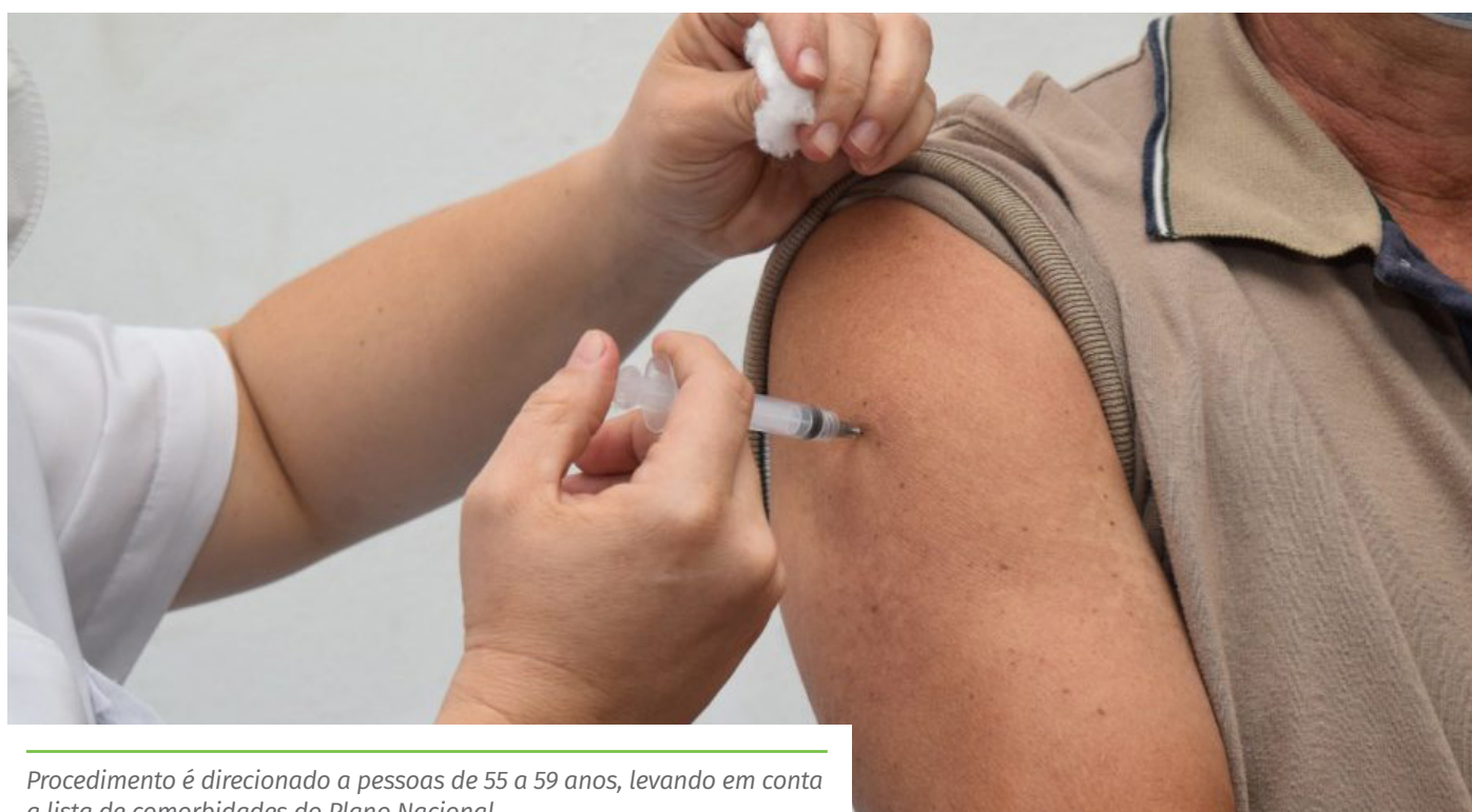
Procedimento é direcionado a pessoas de 55 a 59 anos, levando em conta a lista de comorbidades do Plano Nacional

– Para vacinar pessoas com deficiência permanente, de 55 a 59 anos, cadastradas no Programa de Benefício de Prestação Continuada (BPC), será considerado o cadastro do programa e levantamento junto à Secretaria Municipal de Desenvolvimento Social (Semdes).