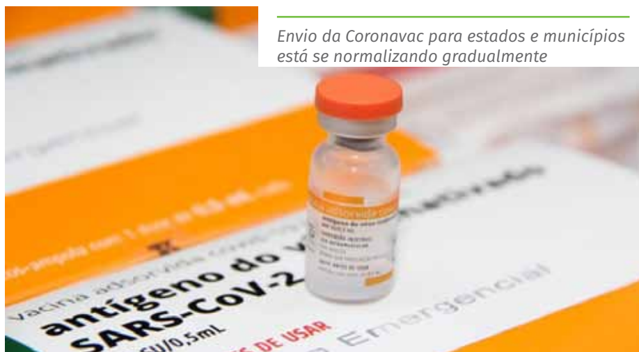
Envio da Coronavac para estados e municípios está se normalizando gradualmente

Confira os Contatos das Unidades Básicas de Saúde, pelo portal: www.cachoeiro.es.gov.br/noticias