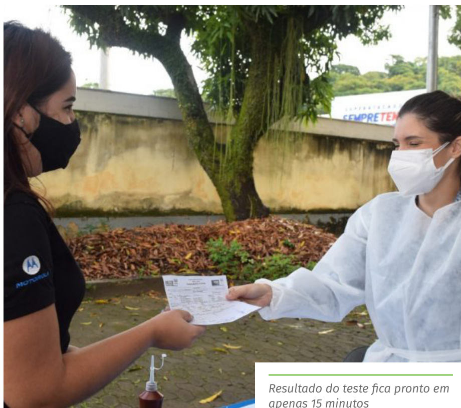
Resultado do teste fica pronto em apenas 15 minutos

minutos e têm precisão de mais de 90%. O objetivo da Prefeitura de Cachoeiro é de ampliar o acesso gratuito aos testes de Covid-19, o que ajuda no mapeamento da doença e possibilita a interrupção da cadeia de transmissão do vírus, a partir do isolamento domiciliar de quem testa positivo.