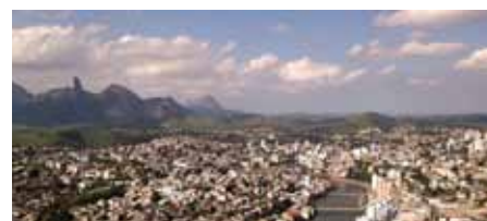
Requerentes com processos parados têm até 30 de junho para manifestar interesse na continuidade