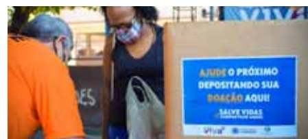
Pela manhã, a quadra esportiva do bairro terá um ponto de doação de alimentos e itens de higiene

“Compartilhe Amor”, das secretarias Municipal de Desenvolvimento Social e de Saúde, que tem pontos de coleta de alimentos, álcool em gel e sabão nas Unidades Básicas de Saúde (UBS) de Cachoeiro.