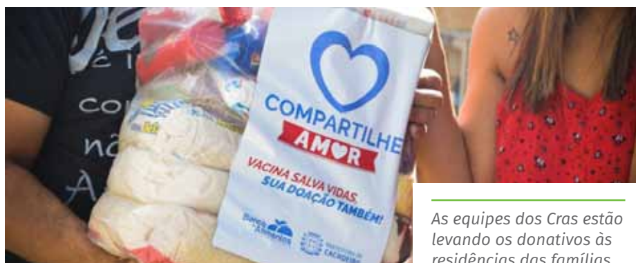
As equipes dos Cras estão levando os donativos às residências das famílias