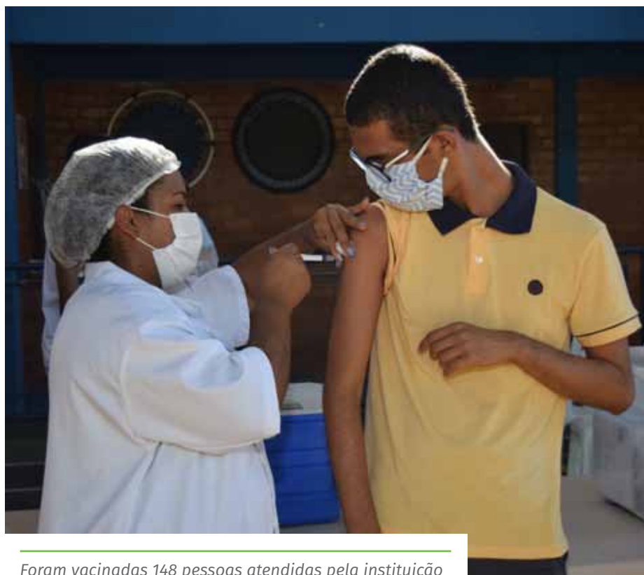
Foram vacinadas 148 pessoas atendidas pela instituição

Confira os Contatos das Unidades Básicas de Saúde, pelo portal: www.cachoeiro.es.gov.br/noticias