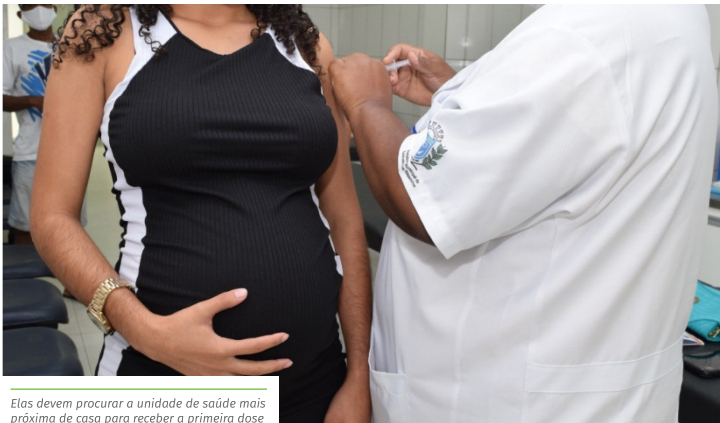
Elas devem procurar a unidade de saúde mais próxima de casa para receber a primeira dose

Se a gestante ou puérpera tiver tomado a vacina contra a gripe (influenza), deve esperar um intervalo de, pelo menos, 14 dias para receber a dose contra o coronavírus.