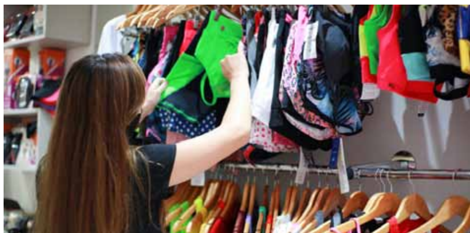
Recomendações ajudam consumidores na tarefa de escolher o presente das mães

Confira mais dicas no portal: www.cachoeiro.es.gov.br/noticias