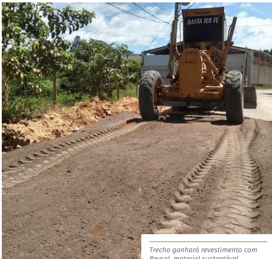
Trecho ganhará revestimento com Revsol, material sustentável

Nesta semana, o trecho pavimentado da estrada de São Joaquim recebeu uma operação tapa-buraco, coordenada pela Secretaria Municipal de Manutenção e Serviços.