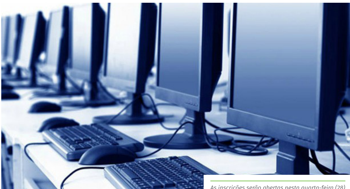
As inscrições serão abertas nesta quarta-feira (28)

PAR (plano de ações articuladas): O Plano de Ações Articuladas (PAR) é uma estratégia de assistência técnica e financeira iniciada pelo Plano de Metas Compromisso Todos pela Educação, que consiste em oferecer, aos entes federados, um instrumento de diagnóstico e de planejamento de política educacional, concebido para estruturar e gerenciar metas definidas de forma estratégica, contribuindo para a construção de um sistema nacional de ensino.