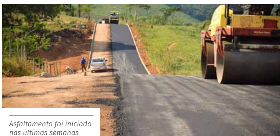
Asfaltamento foi iniciado nas últimas semanas

algumas vias que mais necessitavam. Durante a semana, também serão contemplados, com as intervenções, a avenida Jones dos Santos Neves (em frente ao Café Campeão) e o acesso ao distrito industrial de São Joaquim, além de ruas nos bairros Centro e Nova Brasília. O trabalho é executado pela Secretaria Municipal de Manutenção e Serviços (Semmat).