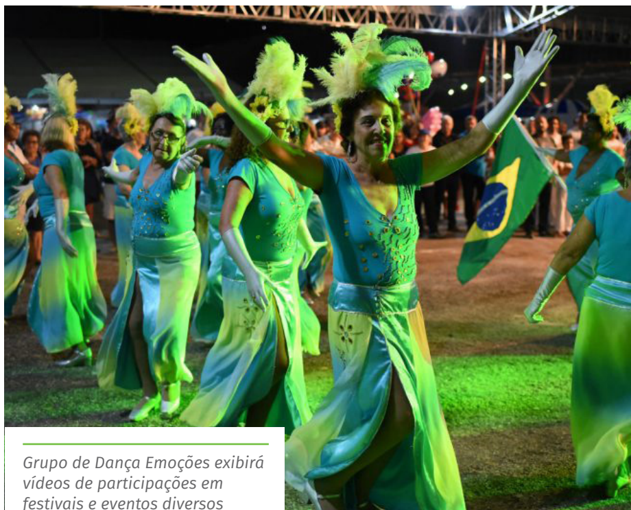
Grupo de Dança Emoções exibirá vídeos de participações em festivais e eventos diversos

Confira a agenda cultural completa no portal: www.cachoeiro.es.gov.br/noticias