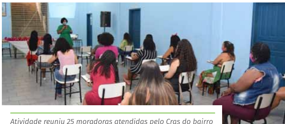
Atividade reuniu 25 moradoras atendidas pelo Cras do bairro

O evento foi promovido pela Secretaria Municipal de Desenvolvimento Social (Semdes), por meio do programa de Promoção do Acesso ao Mundo do Trabalho (Acessuas Trabalho), em parceria com o programa Qualificar-ES, do governo estadual.