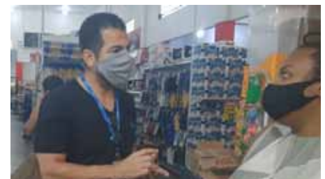
Equipe do órgão municipal instrui os responsáveis pelos estabelecimentos sobre a iniciativa

“Trata-se de uma campanha educativa, que também insere o consumidor em um contexto de conscientização do seu papel, tendo como pano de fundo a cooperação técnica com o Procon Estadual, por se tratar de um convênio entre esse órgão e a Acaps”, destaca.