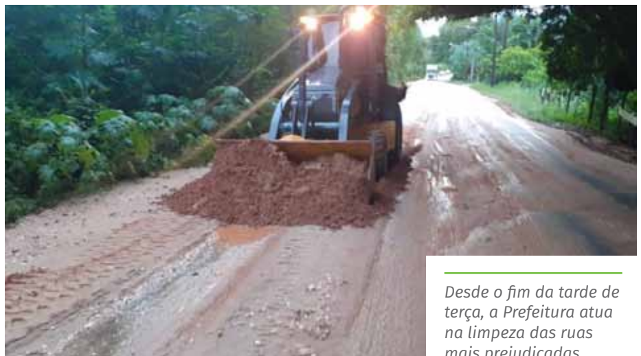
Desde o fim da tarde de terça, a Prefeitura atua na limpeza das ruas mais prejudicadas

Os moradores afetados pelas chuvas podem acionar a Defesa Civil pelos telefones 199 (horário comercial) e 98814-3497 (plantão 24h).