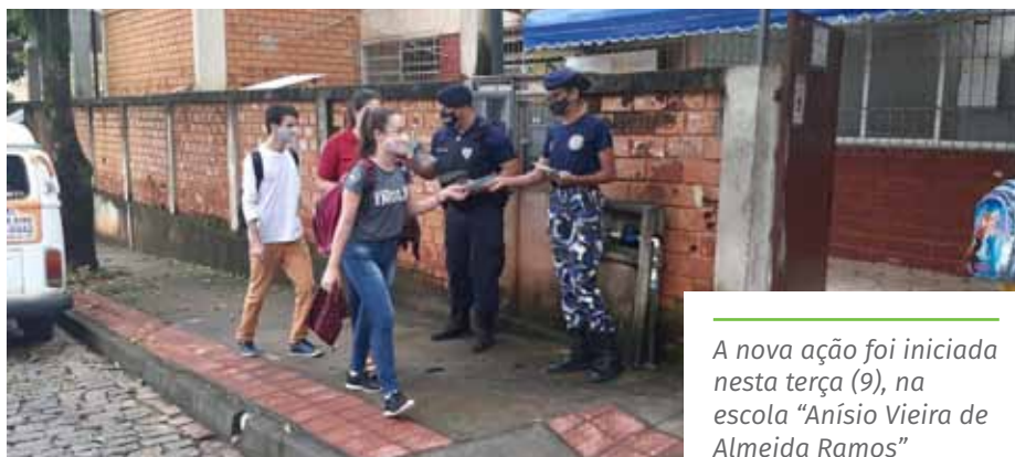
A nova ação foi iniciada nesta terça (9), na escola “Anísio Vieira de Almeida Ramos”

Outras atividades também fazem parte do trabalho da Rope, como palestras e interações lúdicas com os alunos de todas as etapas de ensino, com foco em temas como respeito e disciplina.