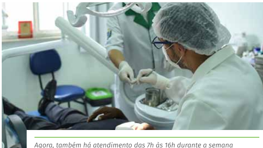
Agora, também há atendimento das 7h às 16h durante a semana