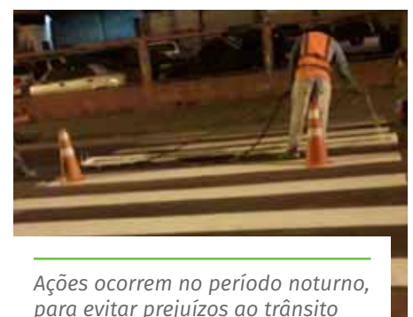
Ações ocorrem no período noturno, para evitar prejuízos ao trânsito