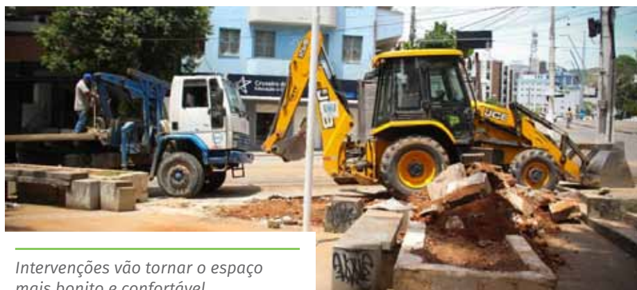
Intervenções vão tornar o espaço mais bonito e confortável

A Praça de Fátima, no Centro, também recebeu melhorias, bem como a praça Portinari, mais conhecida como “Praça dos Macacos”, localizada no bairro Gilberto Machado.