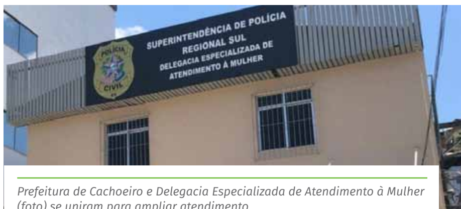
Prefeitura de Cachoeiro e Delegacia Especializada de Atendimento à Mulher (foto) se uniram para ampliar atendimento

É possível realizar a denúncia de violência contra a mulher por meio do 180 (Central de Atendimento à Mulher) e, também, pelo telefone da Delegacia Especializada de Atendimento à Mulher de Cachoeiro: (28) 3155-5084. A delegacia fica na rua Coelho Melo, nº 1, no bairro Independência, em frente ao Fórum.