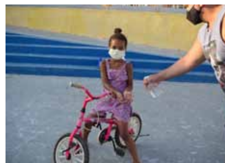
Na quinta-feira (28), os servidores estiveram na praça Sonia Vasconcelos Alves, no bairro Coramara

públicos do município também têm sido contemplados, regularmente, com o serviço de desinfecção realizado pela Prefeitura.