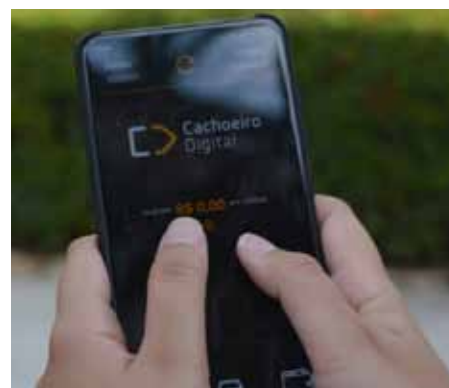
Aplicativo de celular e pontos de venda em lojas estão entre as opções