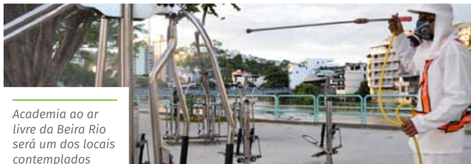
Academia ao ar livre da Beira Rio será um dos locais contemplados

As aplicações são realizadas com suporte de um pulverizador e de um caminhão-pipa, sempre a partir das 18h. O serviço é coordenado pelo Sistema de Comando de Operações (SCO) de enfrentamento da pandemia.