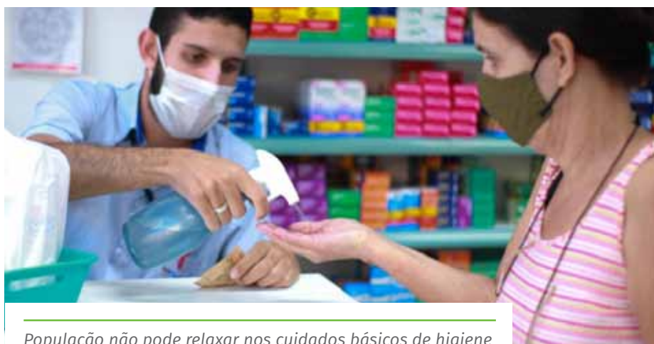
População não pode relaxar nos cuidados básicos de higiene

O Disk Aglomeração funciona 24 horas, atendendo denúncias de desrespeitos às medidas implementadas para combater a pandemia. Para denunciar, qualquer cidadão pode ligar para o telefone 153, acessar a página cachoeiro.es.gov.br/ouvidoriageral ou fazer a manifestação por meio do aplicativo de celular “Todos Juntos”.