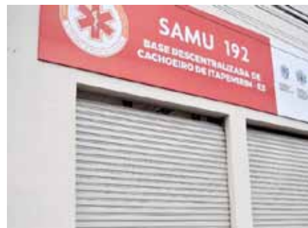
Base do Serviço de Atendimento Móvel de Urgência funcionará no Baiminas

O serviço funciona 24 horas, a partir de chamado telefônico, com prestação de orientações e envio de unidade móvel e equipe capacitada para realização do atendimento.