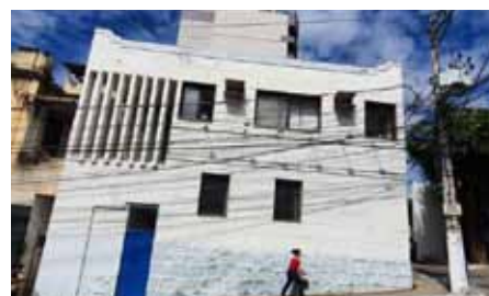
No local, são feitos atendimentos relacionados a programas e benefícios sociais

Mais informações sobre os benefícios podem ser conferidas por meio do número 3155- 5235 ou, ainda, no site www.cachoeiro.es.gov.br , na área de “Benefícios e Programas Sociais”, na página da Semdes.