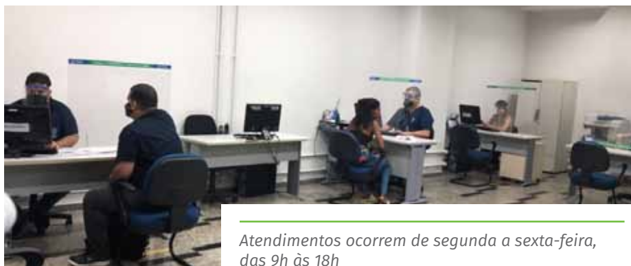
Atendimentos ocorrem de segunda a sexta-feira, das 9h às 18h

Paratirar dúvidas e evitar aglomerações no local, os empreendedores têm a opção de entrar em contato com o espaço por meio dos telefones (28) 3155-5292 ou (28) 3522-4445.