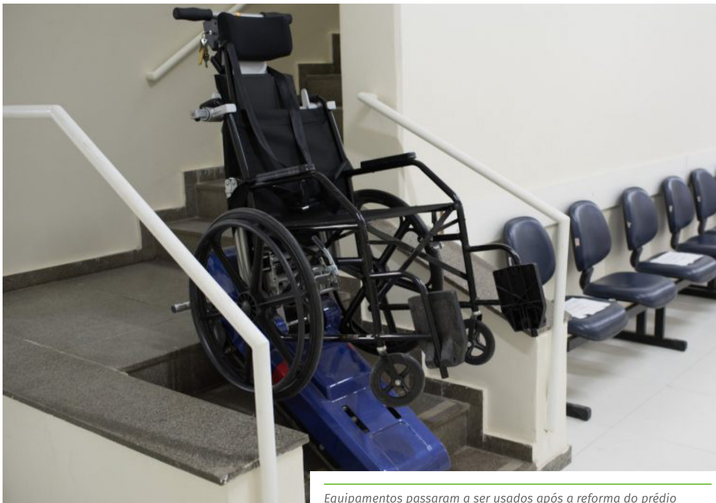
Equipamentos passaram a ser usados após a reforma do prédio

“Em Cachoeiro, apesar dos desafios, desejamos ter um olhar diferenciado para a mobilidade que a nossa cidade precisa, buscando garantir o direito de ir e vir de todos”, finaliza.