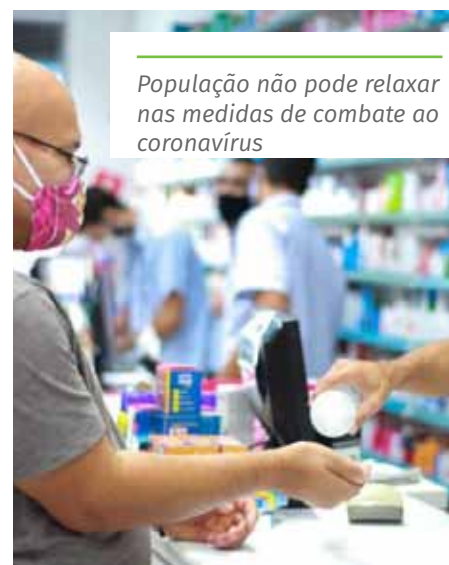
População não pode relaxar nas medidas de combate ao coronavírus

De acordo com o último boletim publicado pela Secretaria de Estado da Saúde (Sesa), na tarde desta segunda-feira (11), Cachoeiro apresenta 13.127 casos confirmados, 12.447 pacientes curados e 266 mortes em decorrência da Covid-19. Informações sobre a pandemia no município podem ser acompanhadas no site cachoeiro.es.gov.br/covid19 .