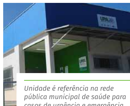
Unidade é referência na rede pública municipal de saúde para casos de urgência e emergência

O telefone de contato da Unidade de Pronto Atendimento 24 horas é o (28) 3155-5014.