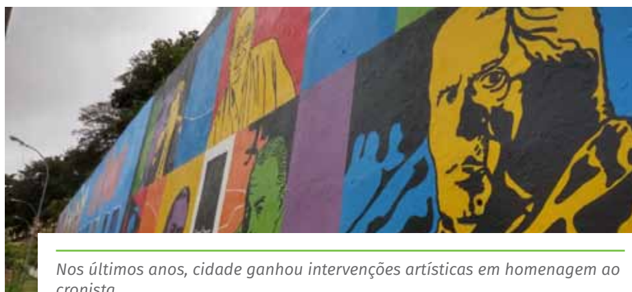
Nos últimos anos, cidade ganhou intervenções artísticas em homenagem ao cronista

Além disso, Cachoeiro tem a Bienal Rubem Braga, maior evento literário do Espírito Santo, que não pôde ser realizado pela Prefeitura em 2020, em função da pandemia.