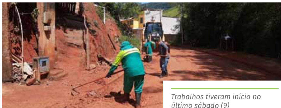
Trabalhos tiveram início no último sábado (9)

Moradores que precisarem solicitar serviços de limpeza semelhantes devem entrar em contato com a Ouvidoria Geral do município, por meio do telefone 156, do Portal da Prefeitura ( cachoeiro.es.gov.br ) ou pelo aplicativo TodosJuntos, que pode ser baixado gratuitamente na loja de aplicativos do smartphone.