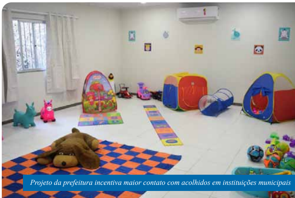
Projeto da prefeitura incentiva maior contato com acolhidos em instituições municipais

O “Padrinho Provedor” é o que dá suporte material ou financeiro à criança ou ao adolescente, seja com a concessão de materiais escolares, vestuário, brinquedos,