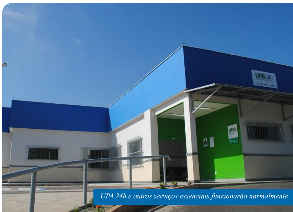
UPA 24h e outros serviços essenciais funcionarão normalmente

Os agentes de trânsito atuarão em regime de escala e haverá fiscalização em todos os dias do