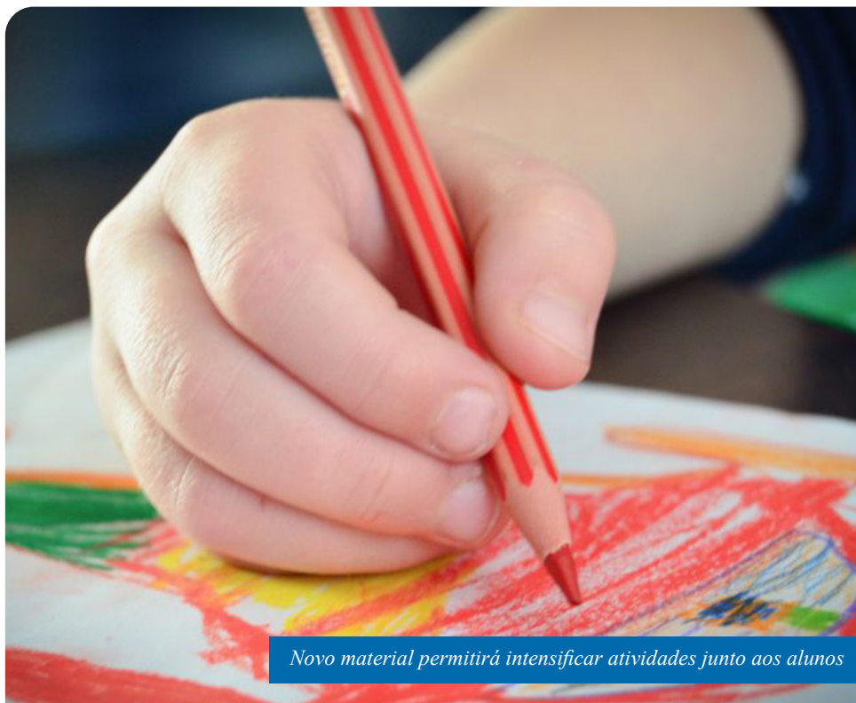
Novo material permitirá intensificar atividades junto aos alunos

“As aquisições foram realizadas com intuito de fortalecer e aperfeiçoar metodologias voltadas aos campos de experiência da alfabetização na educação infantil e possibilitar aos professores dessa área uma gama de conhecimentos e ampla formação continuada, que favoreça a participação ativa