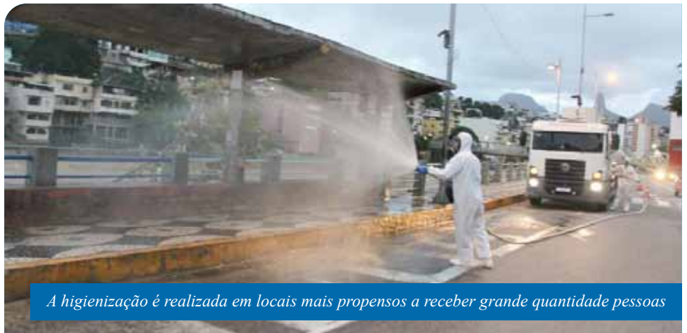
A higienização é realizada em locais mais propensos a receber grande quantidade de pessoas

Na quinta (24), o serviço seguirá para as bases da Guarda Civil Municipal (GCM) e da Defesa