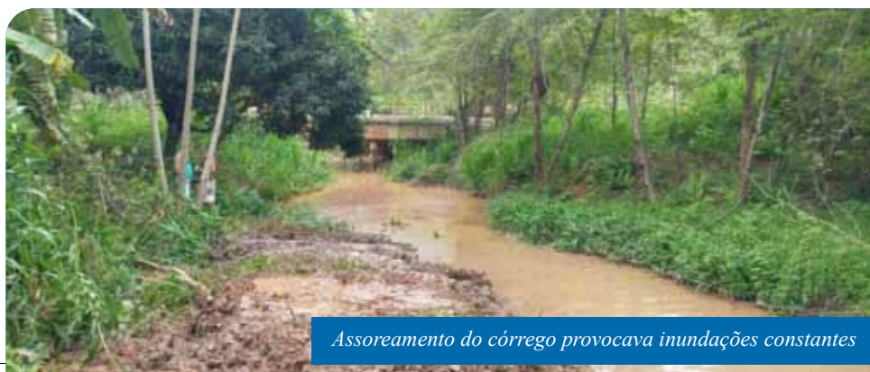
Assoreamento do córrego provocava inundações constantes

Também estão avançando as ações de reconstrução da Ponte do Avelar e da ponte de Usina São Miguel, no distrito de São Vicente, destruídas na enchente de janeiro. A expectativa é de que as obras, de responsabilidade do Departamento de Edificações e de Rodovias do Espírito Santo (DER-ES), sejam concluídas no início do ano que vem.