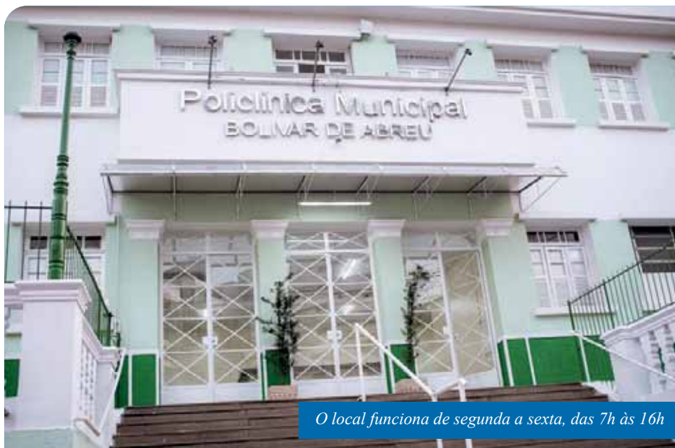
O local funciona de segunda a sexta, das 7h às 16h

A Policlínica Municipal “Bolívar de Abreu”