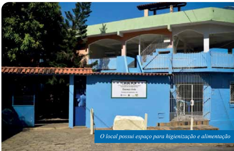
O local possui espaço para higienização e alimentação

De acordo com a Secretaria Municipal de Desenvolvimento Social (Semdes), durante a pandemia, pessoas em situação de rua que se dirigem até o local com sintomas gripais são encaminhada para o Centro de Saúde “Paulo Pereira” (PPG). Em seguida, havendo necessidade do isolamento, o Centro Pop disponibiliza um abrigo temporário para os que precisam desse auxílio. Até esta quarta-feira (16), foram 28 pessoas abrigadas e apenas três