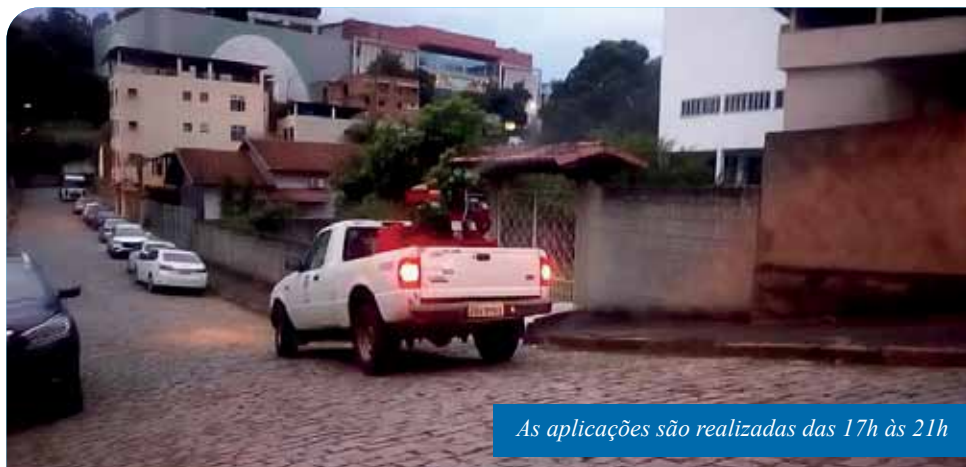
As aplicações são realizadas das 17h às 21h

Nesta semana, o serviço de carro fumacê realizará aplicação espacial de inseticida em mais quatro bairros que registram casos de dengue, zika e chikungunya, doenças transmitidas pelo mosquito Aedes aegypti .