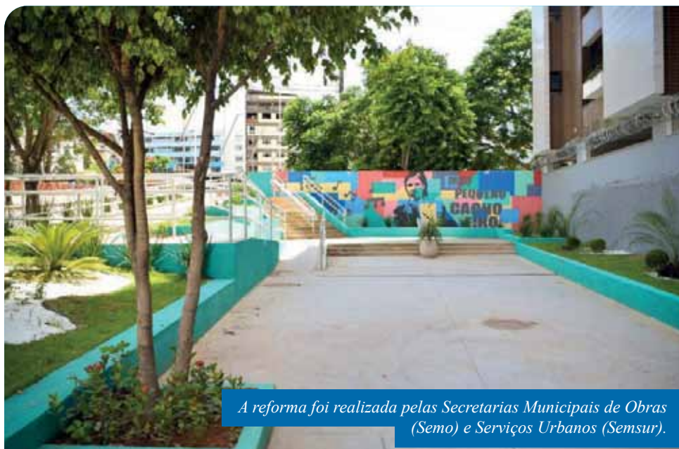
A reforma foi realizada pelas Secretarias Municipais de Obras (Semo) e Serviços Urbanos (Semsur).

“Mais um espaço revitalizado em Cachoeiro. Estamos felizes de poder entregar mais essa obra, que melhora a qualidade de vida das pessoas e faz com que nossa cidade fique mais