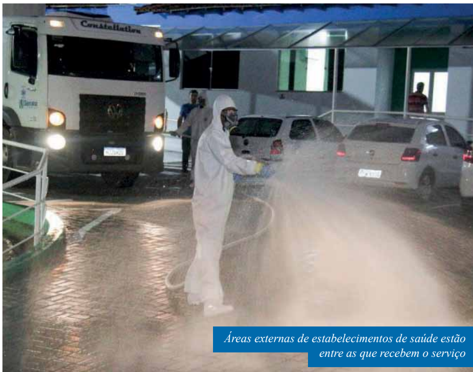
Áreas externas de estabelecimentos de saúde estão entre as que recebem o serviço

Na quinta (17), o trabalho seguirá para o Centro de Saúde “Paulo Pereira Gomes” (PPG); a academia ao ar livre do Baiminas; o Aprisco Rei Davi e o Centro Estadual de Educação de Jovens e Adultos (Ceeja), no Independência. O espaço Viva Mais do Paraíso e o Hospital