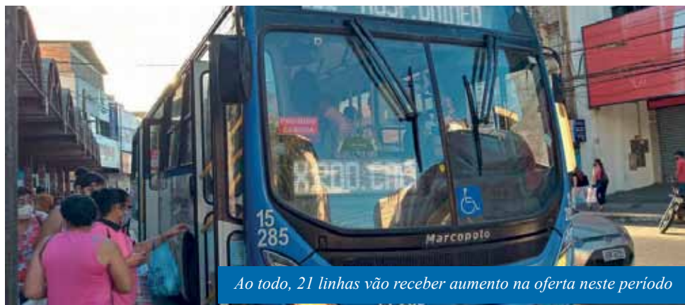
Ao todo, 21 linhas vão receber aumento na oferta neste período

O transporte coletivo municipal de Cachoeiro vai operar com viagens extras, durante 10 dias, a partir desta segunda-feira (14). O reforço visa