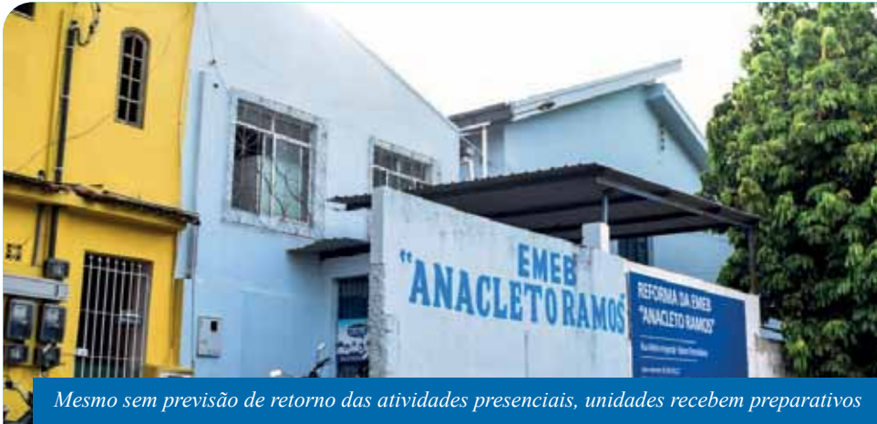
Mesmo sem previsão de retorno das atividades presenciais, unidades recebem preparativos

Embora o retorno às aulas presenciais ainda não tenha data definida, escolas municipais de Cachoeiro de Itapemirim estão recebendo melhorias para o novo ano letivo.