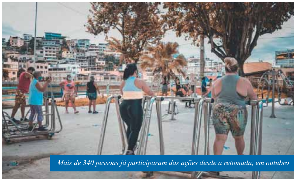
Mais de 340 pessoas já participaram das ações desde a retomada, em outubro

Segundo a Semesp, já está sendo definido o cronograma das atividades e bairros que retomarão as ações dos núcleos esportivos e de qualidade vida a partir de janeiro.