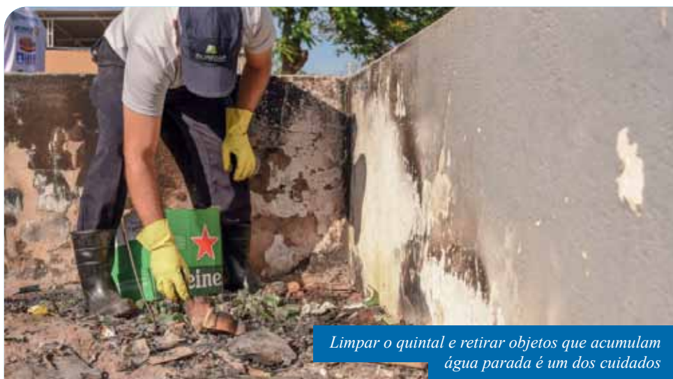
Limpar o quintal e retirar objetos que acumulam água parada é um dos cuidados

A Secretaria Municipal de Saúde (Semus) alerta a população para os cuidados com o mosquito Aedes aegypti , transmissor de doenças como dengue, zika e chikungunya.