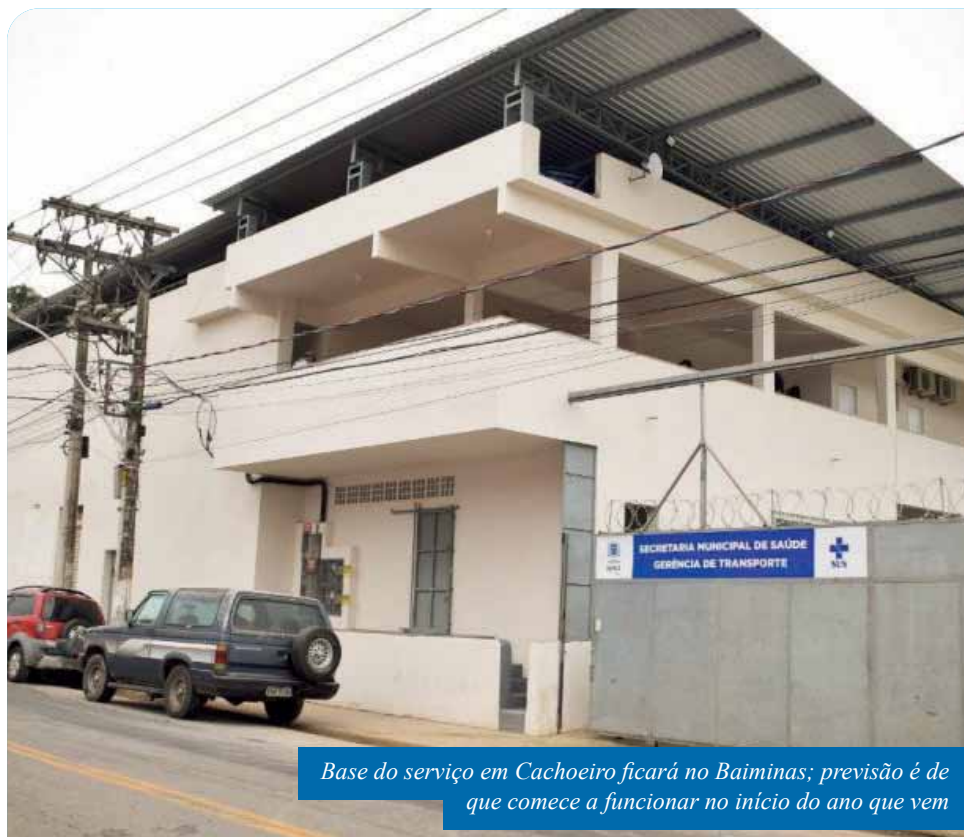
Base do serviço em Cachoeiro ficará no Baíminas; previsão é de que comece a funcionar no início do ano que vem

O Samu é um serviço de atendimento pré-hospitalar. O objetivo é fazer com que profissionais de saúde iniciem, da forma