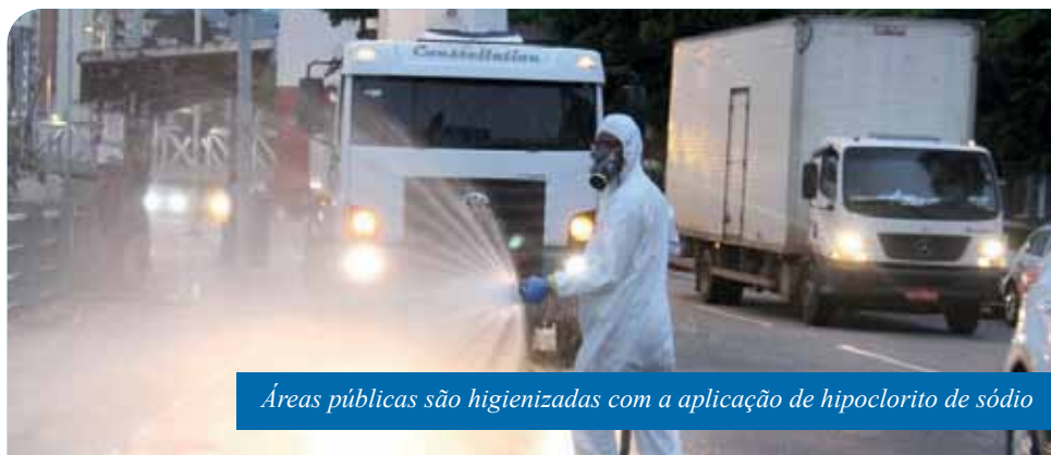
Áreas públicas são higienizadas com a aplicação de hipoclorito de sódio

O serviço de limpeza anticoronavírus, realizado pela Prefeitura de Cachoeiro, desde março deste ano, segue cronograma de rotina nesta semana. Até sexta-feira (11), diversas áreas públicas, da sede e dos distritos, mais propensas a receber grande fluxo de pessoas, receberão as ações.