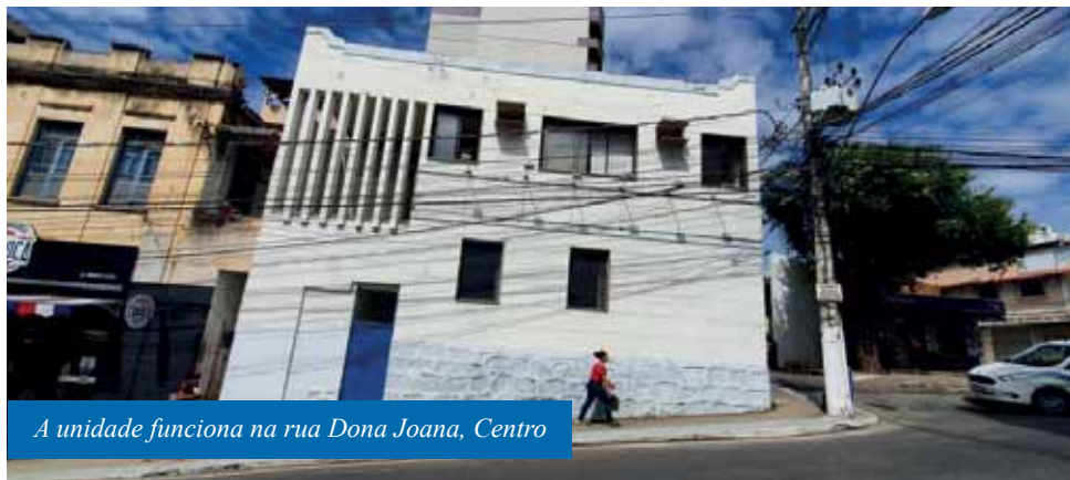
A unidade funciona na rua Dona Joana, Centro

A Secretaria Municipal de Desenvolvimento Social (Semdes) reforça que é possível realizar o requerimento do Benefício de Prestação Continuada (BPC) por meio da Central de Benefícios, localizada na rua Dona Joana, nº 25, no imóvel da esquina com a praça São João, no Centro. A unidade entrou em funcionamento em agosto deste ano.