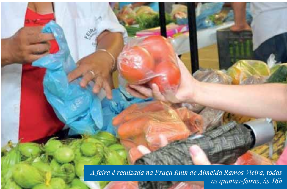
A feira é realizada na Praça Ruth de Almeida Ramos Vieira, todas as quintas-feiras, às 16h

Sobre essa questão, o secretário também lembra que ações para minimizar as aglomerações têm sido tomadas, como é o caso da feira da Ilha da Luz – conhecida como Feira do Servidor – que, durante esse período de pandemia, vem sendo realizada às terças e sextas-feiras, e não mais somente às sextas-feiras, com o objetivo de evitar aglomerações.