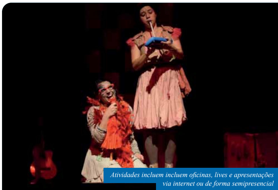
Atividades incluem oficinas, lives e apresentações via internet ou de forma semipresencial

Os municípios também são responsáveis pelo que determina o Inciso II, da Lei Aldir Blanc, que diz respeito à liberação de auxílio emergencial, de até três parcelas de R$ 10 mil, a espaços culturais (coletivos artísticos ou organizações formalmente constituídas).