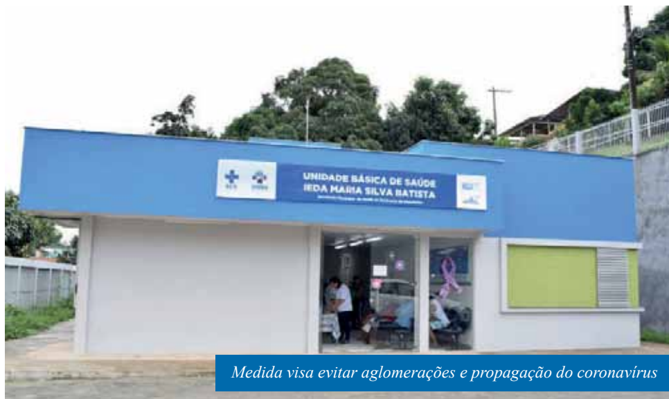
Medida visa evitar aglomerações e propagação do coronavírus

“O número de pacientes com sintomas gripais têm crescido muito e nós precisamos diminuir a circulação de pessoas nas UBS