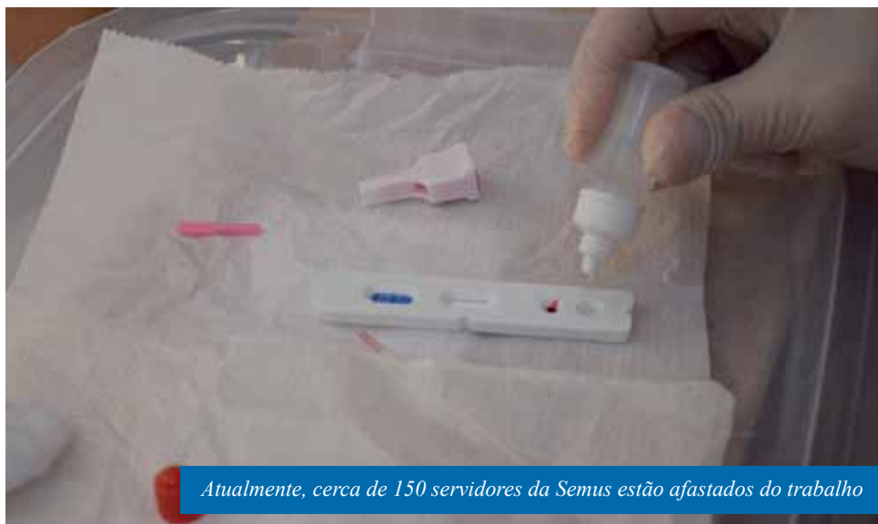
Atualmente, cerca de 150 servidores da Semus estão afastados do trabalho

Em um comunicado, lançado no último mês de setembro, a Organização Panamericana de Saúde (Opas) informou que cerca de 570 mil profissionais de saúde da região das Américas se infectaram e 2,5 mil morreram por Covid-19. De acordo com a Opas, isso se deve, em grande medida, ao fato da região estar entre as que apresentam os números mais elevados de casos da doença, sobrecarregando os sistemas de saúde