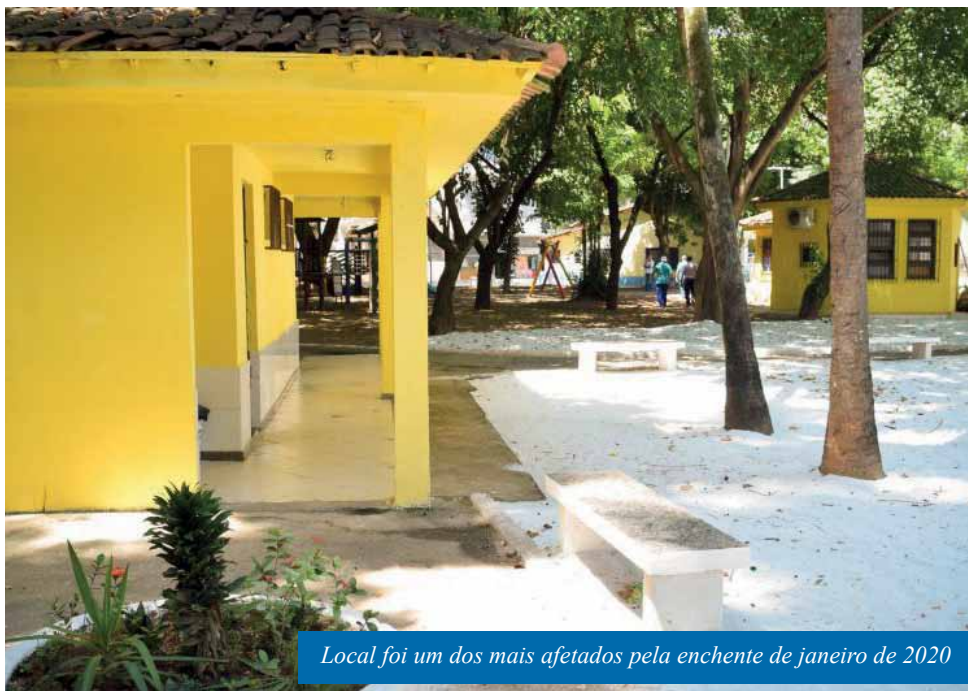
Local foi um dos mais afetados pela enchente de janeiro de 2020

“A Praça de Fátima é um marco de Cachoeiro e, por isso, que esse serviço é tão importante. Queremos que esse local, tão querido por cachoeirenses e visitantes, volte a ficar bonito e seguro. Trabalhando com responsabilidade, estamos reparando os danos causados pela maior enchente da história de Cachoeiro, que deixou