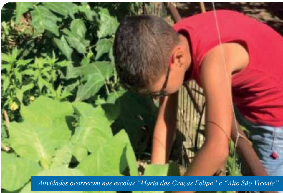
Atividades ocorreram nas escolas “Maria das Graças Felipe” e “Alto São Vicente”

As ações contaram com a participação da comunidade, por meio dos pais e responsáveis. As unidades de ensino utilizaram todos os espaços pertencentes ao prédio escola; reutilizaram vasos; usaram a água do ar-