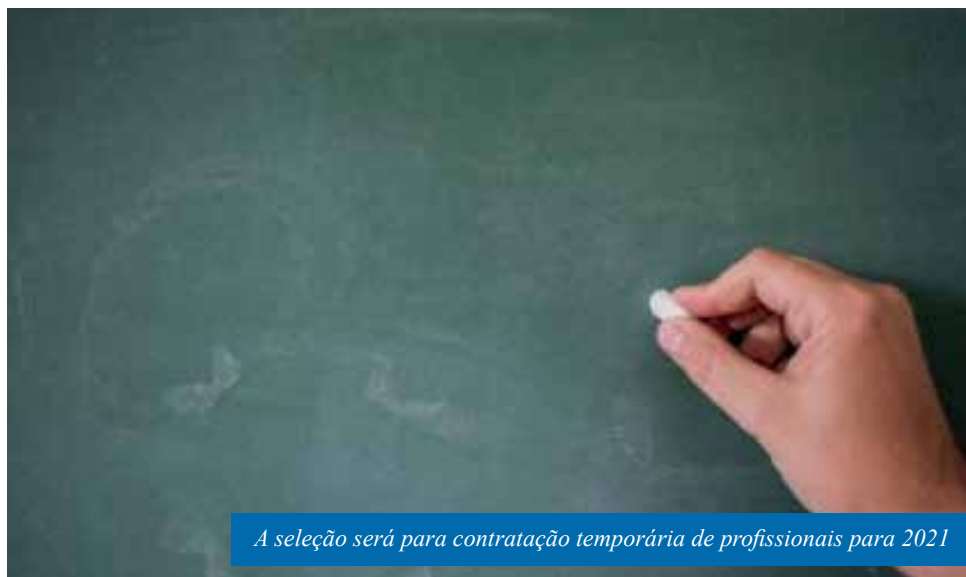
A seleção será para contratação temporária de profissionais para 2021

Finalizado o período de inscrições, haverá a etapa de declaração de títulos, de caráter classificatório, e a chamada para comprovação