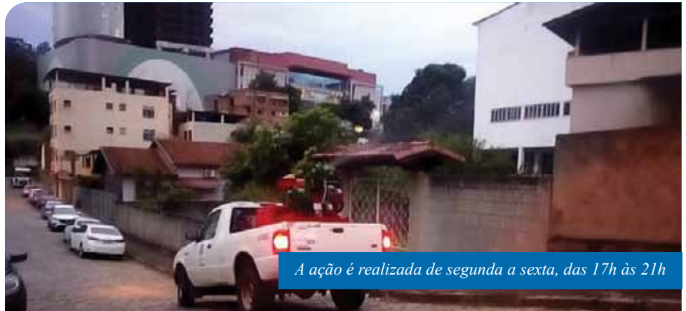
A ação é realizada de segunda a sexta, das 17h às 21h

Além disso, agentes de combate a endemias continuam realizando o serviço de visita domiciliar, no entanto, devido à pandemia de Covid-19, a orientação é que o trabalho seja peridomiciliar, ou seja, com visita somente