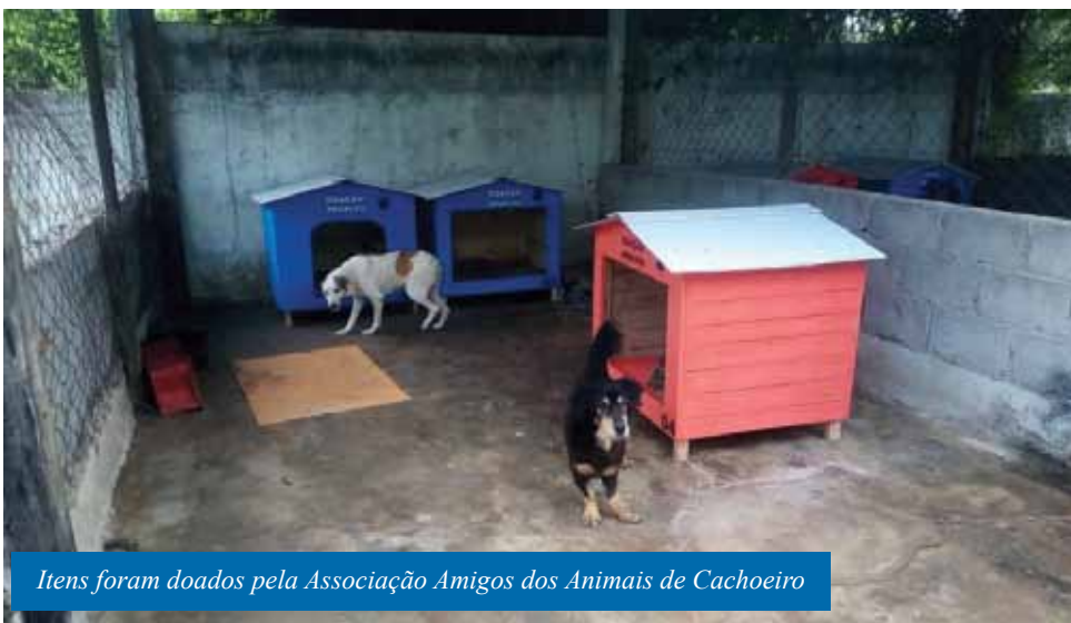
Itens foram doados pela Associação Amigos dos Animais de Cachoeiro

Neste mês, a Unidade de Vigilância de Zoonoses (UVZ), da Secretaria Municipal de Saúde (Semus) de Cachoeiro, recebeu doações de casinhas e tablados para os cães que ficam alojados no local. A ação foi realizada pela Associação Amigos dos Animais de Cachoeiro de Itapemirim (Amakachu).