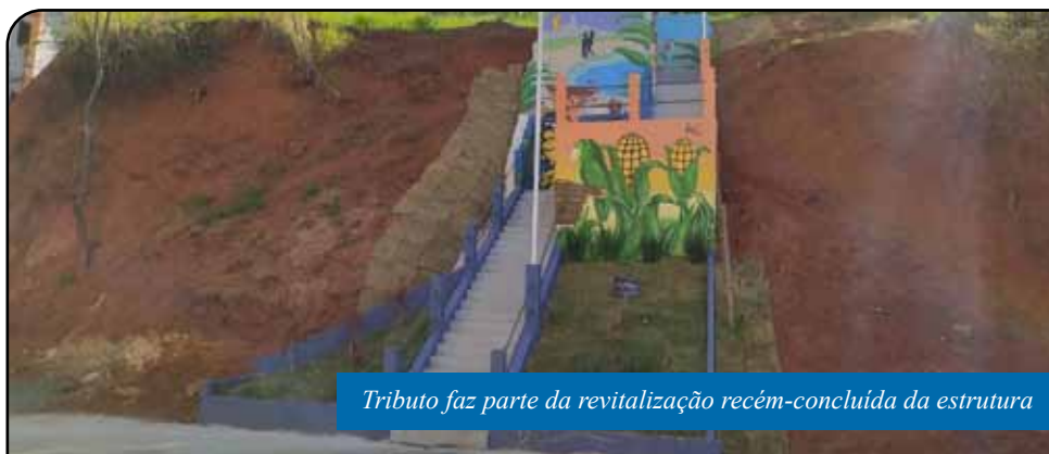
Tributo faz parte da revitalização recém-concluída da estrutura

A revitalização da escadaria foi coordenada pela Secretaria de Serviços Urbanos (Semsur). As melhorias na estrutura incluíram reparos na alvenaria, na iluminação e na calçada de acesso,