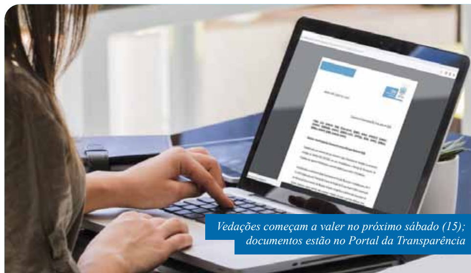
Vedações começam a valer no próximo sábado (15); documentos estão no Portal da Transparência