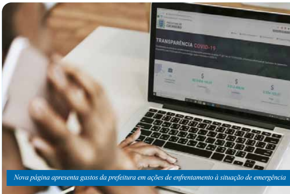
Nova página apresenta gastos da prefeitura em ações de enfrentamento à situação de emergência

mecanismo de controle social das ações do poder público durante a pandemia, dando ampla transparência às informações e favorecendo o