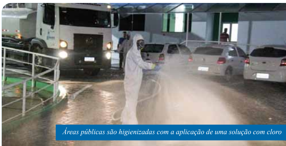
Áreas públicas são higienizadas com a aplicação de uma solução com cloro