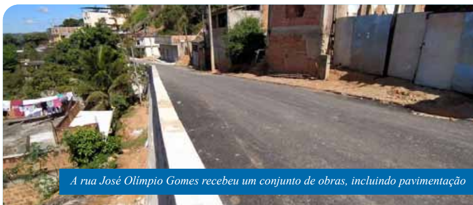
A rua José Olímpio Gomes recebeu um conjunto de obras, incluindo pavimentação

“Procuramos atender, da melhor forma, as demandas da população. Essas obras eram reivindicadas há muito tempo e são de grande importância para a comunidade”, comenta o