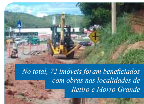
No total, 72 imóveis foram beneficiados com obras nas localidades de Retiro e Morro Grande

“A ampliação das redes de água tratada para comunidades que dependem de carros-pipa para serem abastecidas representa um grande salto na qualidade de vida dos moradores dessas regiões, além de, também, beneficiar estabelecimentos comerciais e possibilitar maior geração de emprego e renda. Estamos trabalhando em um novo Plano Municipal de Saneamento, que possibilitará a inclusão de mais comunidades posteriormente”, destaca o prefeito