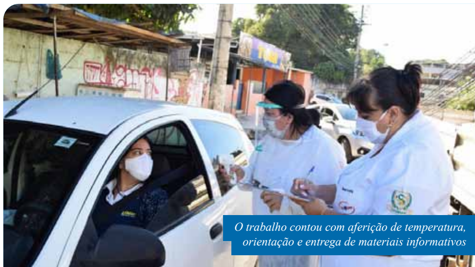
O trabalho contou com aferição de temperatura, orientação e entrega de materiais informativos

Nesta última semana, as barreiras sanitárias alcançaram mais de 1,7 mil pessoas. De segunda (3) a quinta-feira (6), no bairro Independência, os