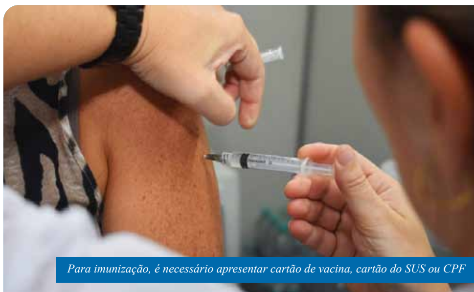
Para imunização, é necessário apresentar cartão de vacina, cartão do SUS ou CPF

Há a opção, também, de ir até uma das quatro Unidades Básicas de Saúde do Programa Saúde na Hora, que tem atendimento estendido até às 19h. São elas: as dos bairros IBC, Aeroporto, Amaral e Paraíso.