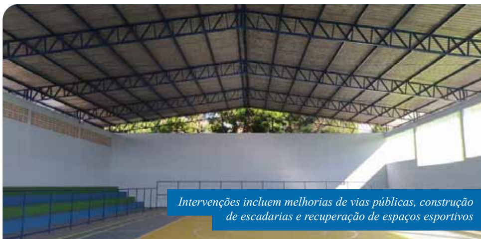
Intervenções incluem melhorias de vias públicas, construção de escadarias e recuperação de espaços esportivos

Já está quase finalizada a reforma da quadra poliesportiva “Luiz Carlos Lovati” (rua Projetada), restando apenas a colocação do novo alambrado, com obras orçadas em R$ 195.626,63. Também é feita a recuperação de uma quadra de areia na rua Sargento Valdemir Simões.