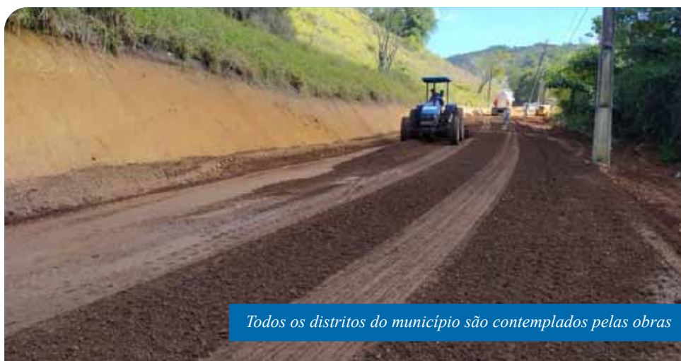
Todos os distritos do município são contemplados pelas obras

“Essas obras são muito aguardadas pelos moradores, que ganharão muito em qualidade de vida. Passamos por um momento extramente desafiador com a pandemia, mas estamos fazendo um grande esforço para atender a todas as demandas da forma mais ágil possível!”, completa o prefeito Victor Coelho, que visitou obras em estradas rurais na semana passada.