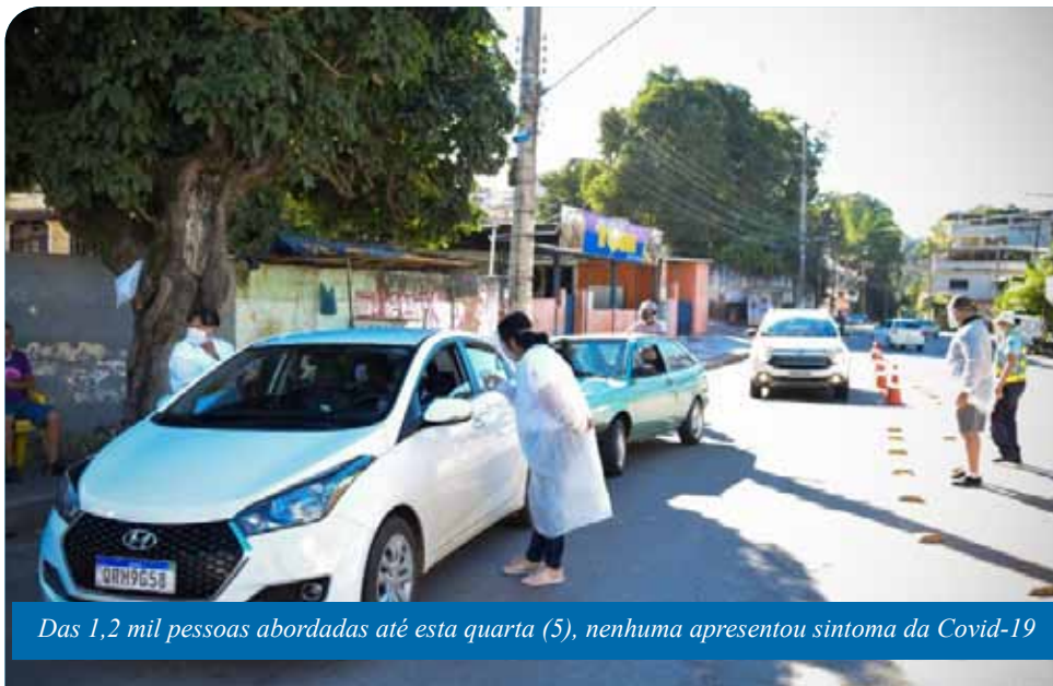
Das 1,2 mil pessoas abordadas até esta quarta (5), nenhuma apresentou sintoma da Covid-19

As barreiras são realizadas nos bairros com maiores índices de contaminados pelo coronavírus. Participam do trabalho: guardas-civis municipais, agentes de trânsito e servidores das secretarias municipais de Desenvolvimento Econômico (Semdec), Esporte e Lazer (Semes), Defesa Civil e estudantes do curso técnico de enfermagem do