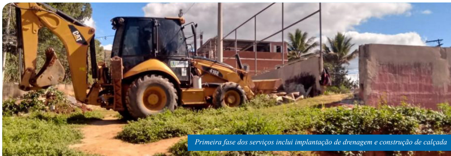
Primeira fase dos serviços inclui implantação de drenagem e construção de calçada