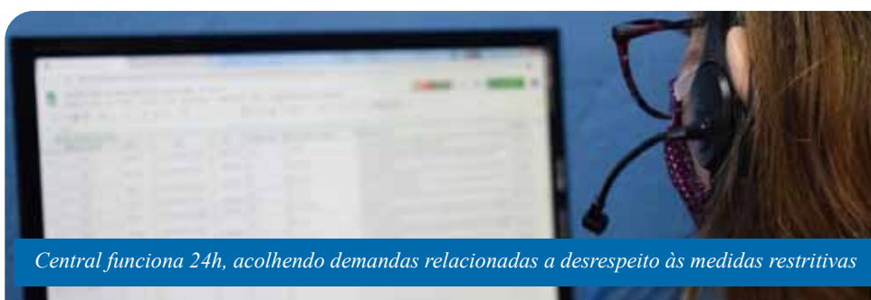
Central funciona 24h, acolhendo demandas relacionadas a desrespeito às medidas restritivas

O Disk Aglomeração pode ser acionado pelo telefone 153 e pelo site cachoeiro.es.gov.br/ouvidoriageral .