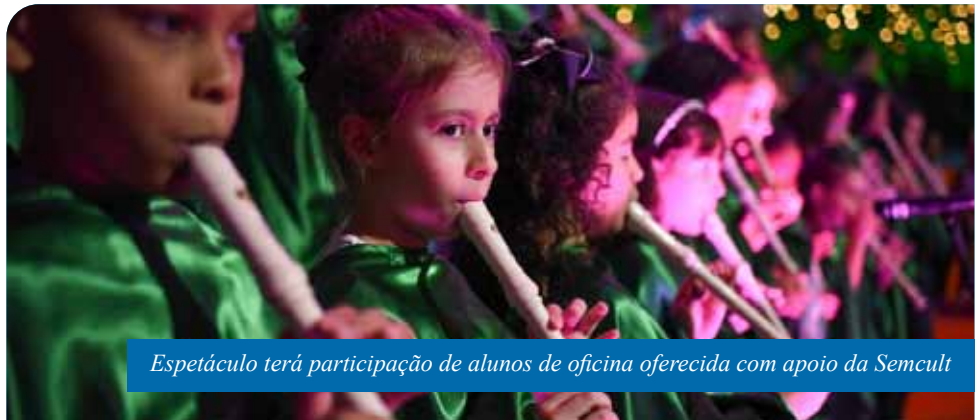
Espectáculo terá participação de alunos de oficina oferecida com apoio da Semcult

Na ocasião, os pequenos artistas abrilhantarão o show com uma apresentação em vídeo. Quem quiser conferir a atração, basta acessar as redes sociais do projeto Casa Verde: no Instagram (@casaverdeprojeto), Facebook (Projeto Casa Verde) ou YouTube (Orquestras Casa Verde).