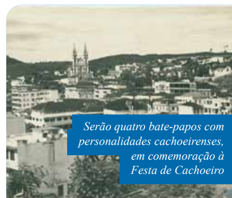
Serão quatro bate-papos com personalidades cachoeirenses, em comemoração à Festa de Cachoeiro