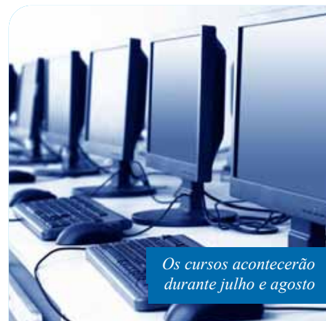
Os cursos acontecerão durante julho e agosto

Controle Social para Conselheiros: Abordará temas referentes ao acompanhamento e ao