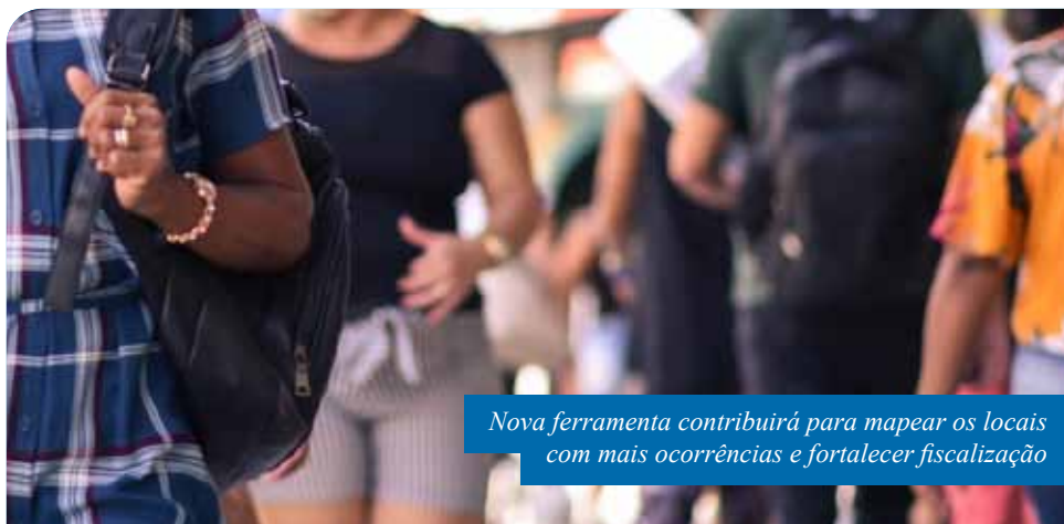
Nova ferramenta contribuirá para mapear os locais com mais ocorrências e fortalecer fiscalização

Além disso, a ferramenta também permite captação de dados a partir de outros dispositivos, como câmeras de celular. Caso um fiscal identifique alguma ocorrência de aglomeração em uma rua ou estabelecimento, por exemplo, ele poderá utilizar o