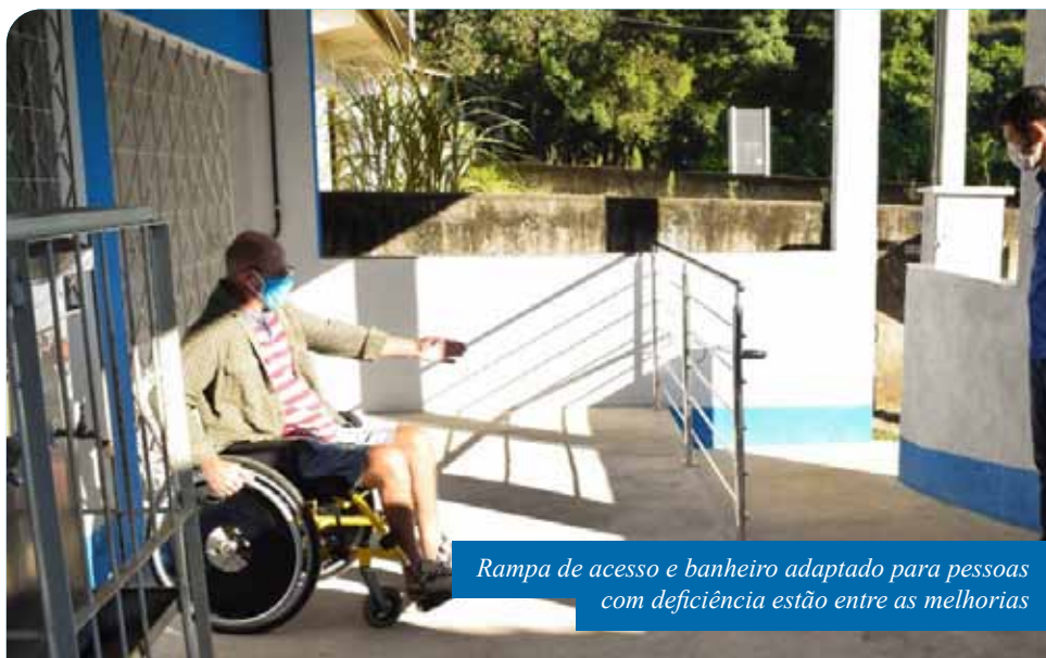
Rampa de acesso e banheiro adaptado para pessoas com deficiência estão entre as melhorias