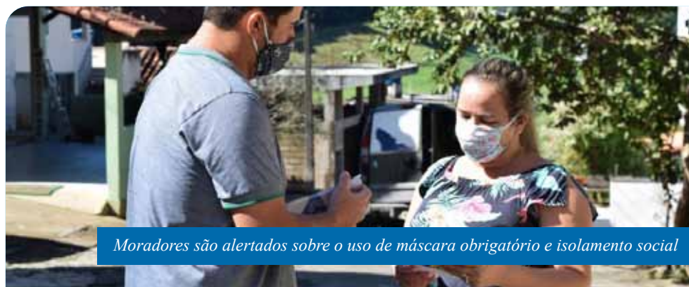
Moradores são alertados sobre o uso de máscara obrigatório e isolamento social

Os moradores de Cachoeiro podem acessar as informações oficiais sobre a situação da Covid-19 no município, incluindo a quantidade de casos por bairro, na plataforma Portal Covid-19 ( www.cachoeiro.es.gov.br/covid19 ). Os dados são atualizados diariamente.