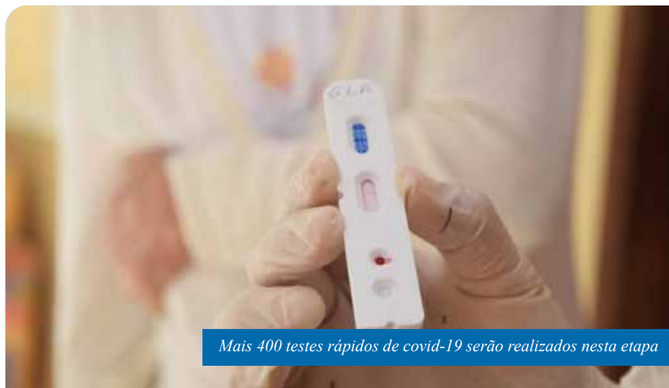
Mais 400 testes rápidos de covid-19 serão realizados nesta etapa

Caso o morador teste positivo, a equipe fará o encaminhamento necessário do paciente, de acordo com sua situação clínica: se estiver assintomático, orientação de isolamento