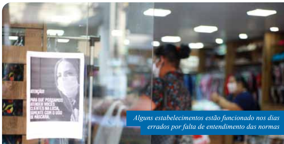
Alguns estabelecimentos estão funcionando nos dias errados por falta de entendimento das normas