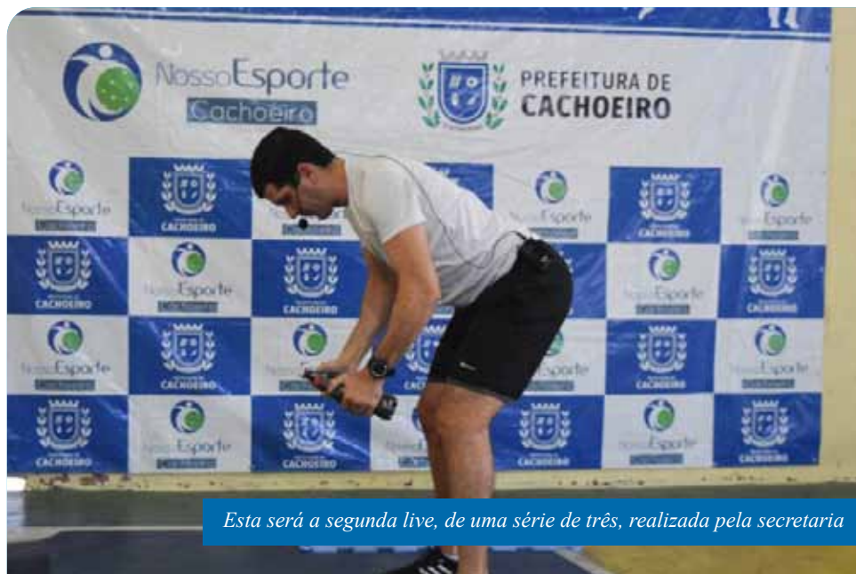
Esta será a segunda live, de uma série de três, realizada pela secretaria

“Essa aula será especial, pois unirá toda a família. Agradeço aos nossos profissionais envolvidos nessas aulas virtuais e convido a todos para participarem dessa live que já tem feito sucesso entre os participantes”, comenta a secretária municipal de Esporte e Lazer,