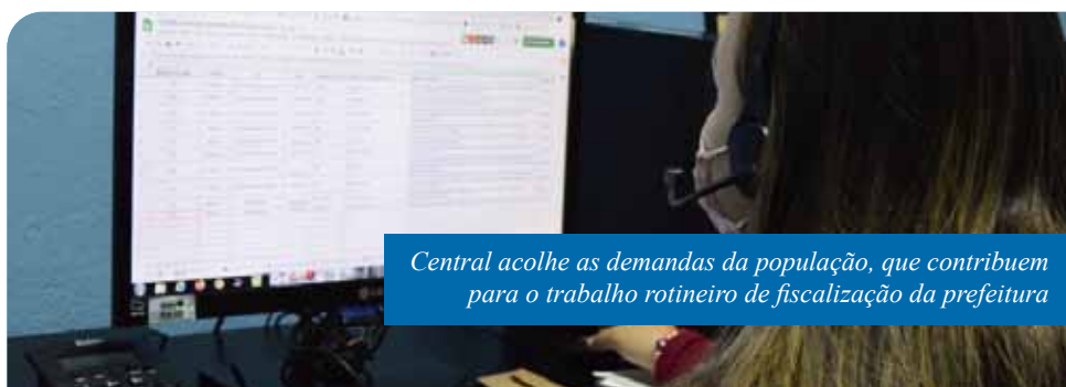
Central acolhe as demandas da população, que contribuem para o trabalho rotineiro de fiscalização da prefeitura

A central do Disk Aglomeração não faz contatos de retorno ao cidadão denunciante, mas qualquer pessoa pode fazer contato quantas vezes considerar necessário. Todas as demandas são registradas e encaminhadas para a equipe de fiscalização ou para a GCM, dependendo do tipo