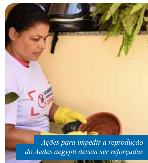
Ações para impedir a reprodução do Aedes aegypti devem ser reforçadas

Dentre as ações desenvolvidas pela Semus para controle do Aedes aegypti , está o serviço de moto fumacê, que realiza aplicação espacial de inseticida em todas as regiões de Cachoeiro. As aplicações são feitas quatro vezes por mês em cada bairro ou localidade, sendo uma por semana, das 5h às 9h ou das 17h às 21h.