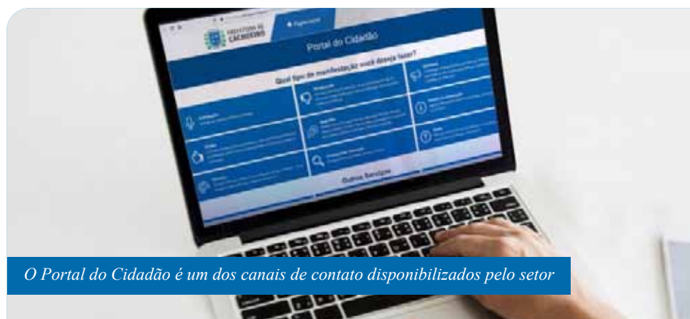
O Portal do Cidadão é um dos canais de contato disponibilizados pelo setor

“Com esses números, mostramos a essencialidade do trabalho desempenhado pela Ouvidoria como canal de informações e orientações aos nossos munícipes. Esse resultado reflete o trabalho conjunto desempenhado por um time de servidores alinhados