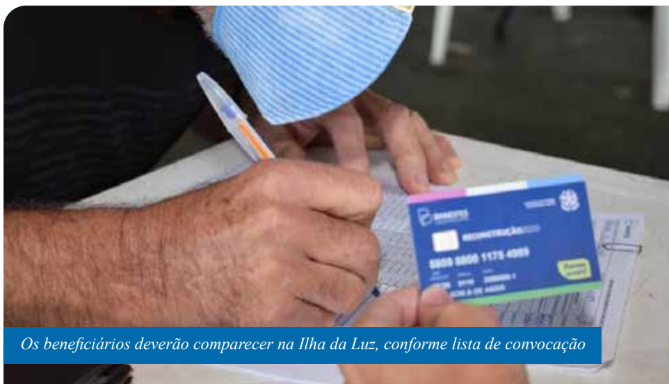
Os beneficiários deverão comparecer na Ilha da Luz, conforme lista de convocação