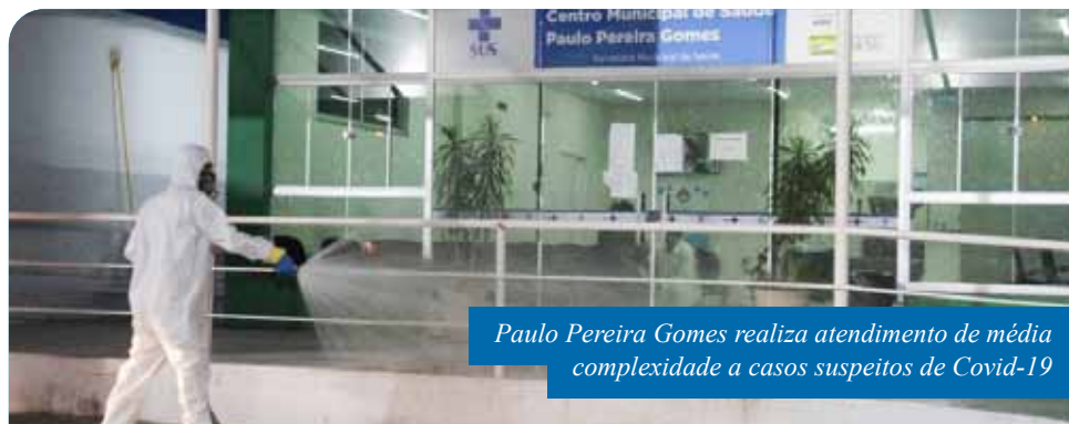
Paulo Pereira Gomes realiza atendimento de média complexidade a casos suspeitos de Covid-19

Para a realização dos serviços de saúde, o PPG disponibiliza 32 leitos, podendo atender até 300 pacientes a cada 24 horas – atualmente, tem realizado de 150 a 200 atendimentos, em média. O equipamento público conta, ainda, com estrutura simplificada, com