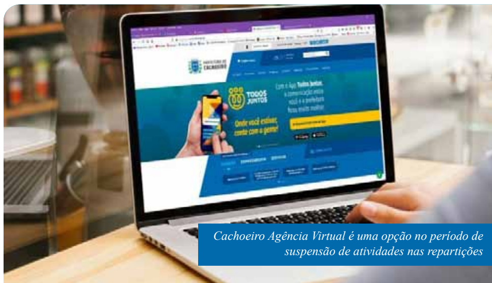
Cachoeiro Agência Virtual é uma opção no período de suspensão de atividades nas repartições

a sexta, das 8h às 17h, por meio do telefone 156 e do WhatsApp (28) 98814-3357 (somente mensagens). Também é possível fazer os registros, a qualquer dia e hora, pelo e-mail ouvidoria@cachoeiro.es.gov.br , pelo Portal do Cidadão ( cachoeiro.es.gov.br/ouvidoriageral ) e pelo aplicativo de celular Todos Juntos.