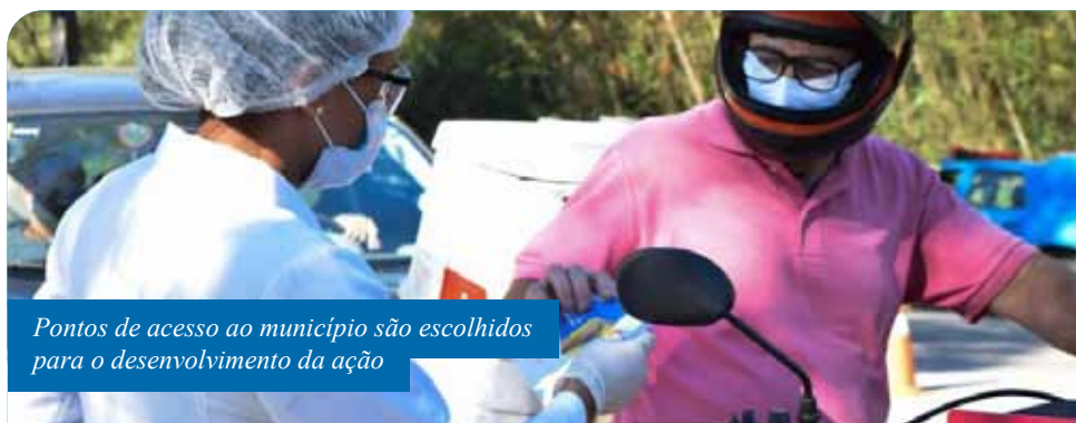
Pontos de acesso ao município são escolhidos para o desenvolvimento da ação

Confira a programação das barreiras no site da Prefeitura ( www.cachoeiro.es.gov.br ).