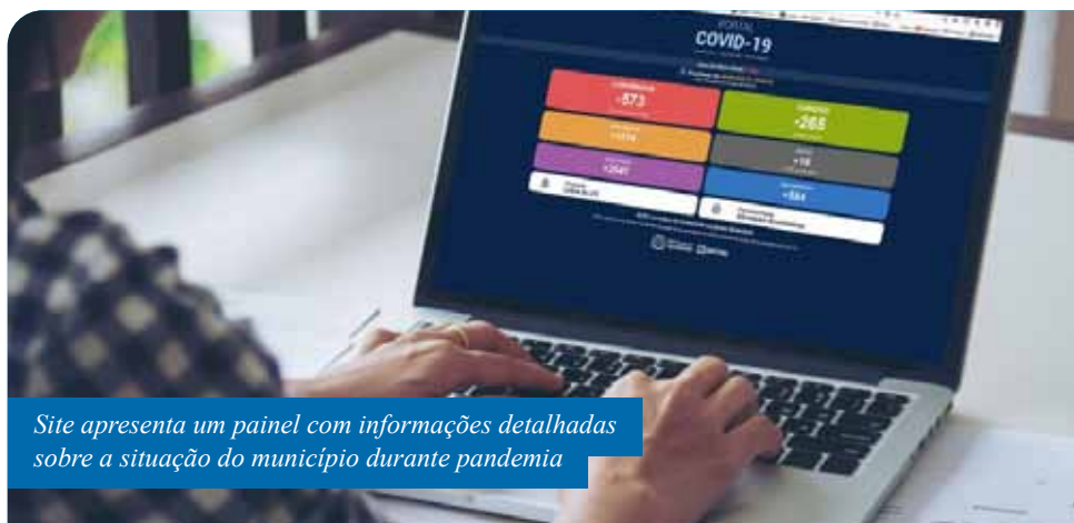
Site apresenta um painel com informações detalhadas sobre a situação do município durante pandemia

Também possível acessar, na página, o plano de contingência do município para o novo coronavírus; informações sobre formas de prevenção à Covid-19; link para o Disk Aglomeração; contratos