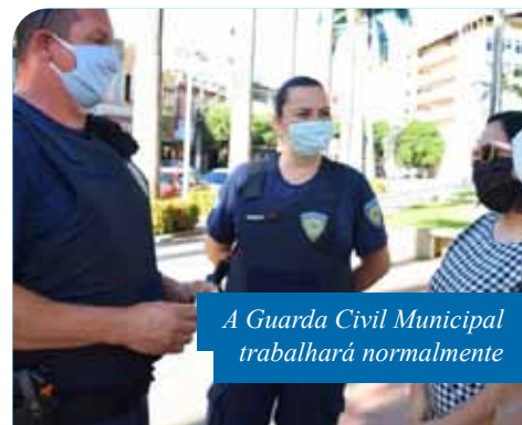
A Guarda Civil Municipal trabalhará normalmente

Para verificar quais farmácias estarão de plantão na quinta (11), os moradores de Cachoeiro podem acessar a lista disponível no site da Prefeitura ( www.cachoeiro.es.gov.br ) – em “Destaques”, na parte inferior da página principal, ou no menu “Serviços”, em Vigilância Sanitária.