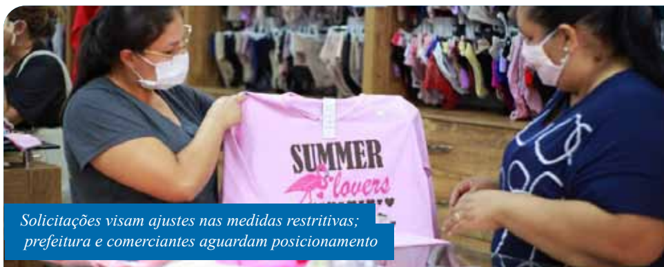
Solicitações visam ajustes nas medidas restritivas; prefeitura e comerciantes aguardam posicionamento

Outra solicitação é para que os estabelecimentos