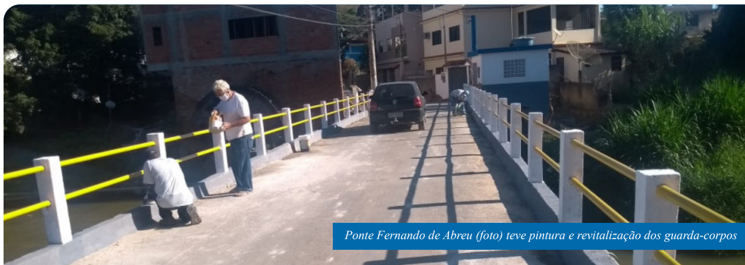
Ponte Fernando de Abreu (foto) teve pintura e revitalização dos guarda-corpos

A Secretaria Municipal de Obras (Semo) de Cachoeiro de Itapemirim realizou, na última semana, reparos em locais do distrito de Conduru danificados pela enchente de janeiro. As ações foram feitas na ponte Fernando de Abreu e nas ruas Antonio Gomes, Anacleto Louzada e Coronel Francisco Athayde.