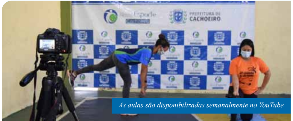
As aulas são disponibilizadas semanalmente no YouTube