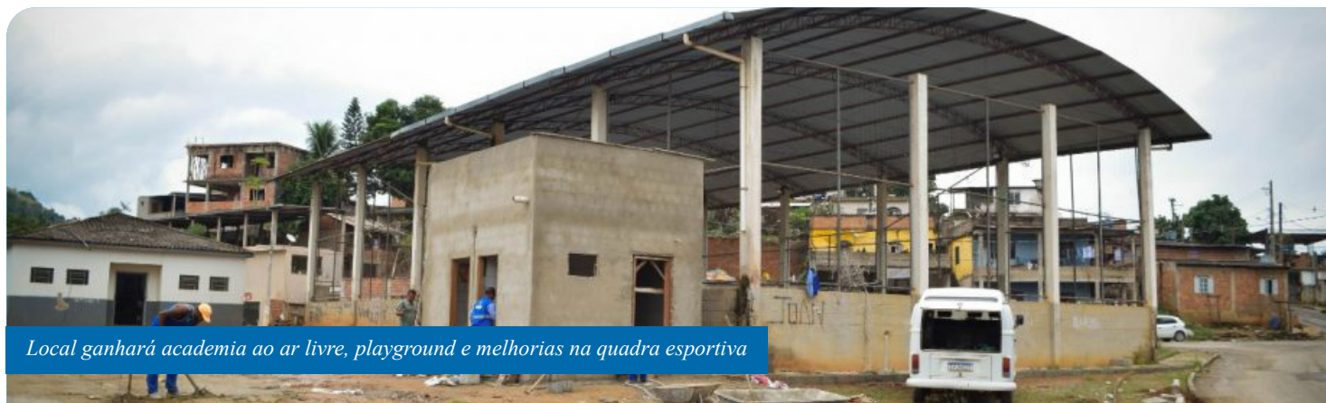
Local ganhará academia ao ar livre, playground e melhorias na quadra esportiva

Coutinho é mais um distrito de Cachoeiro que será beneficiado com obras de revitalização de quadra de esportes, novo playground e, ainda, instalação de academia ao ar livre. Os serviços estão sendo executados na praça local, pelas secretarias municipais de Esporte e Lazer (Semesp), de Serviços Urbanos (Semsur) e de Obras (Semö).