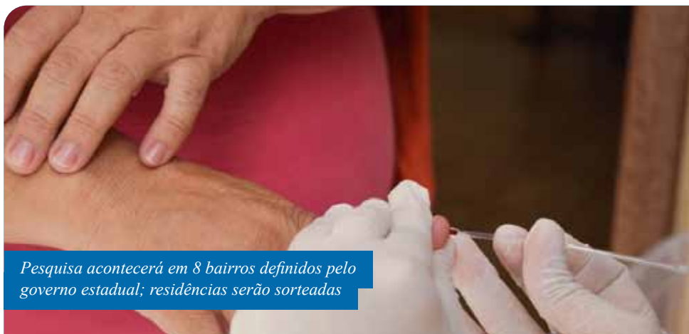
Pesquisa acontecerá em 8 bairros definidos pelo governo estadual; residências serão sorteadas

Caso a pessoa selecionada teste positivo, a equipe testará os demais moradores do imóvel e fará o encaminhamento necessário ao paciente, de acordo com sua situação clínica: se estiver assintomático, orientação de isolamento domiciliar; se apresentar sintomas, recomendação para que procure o Centro de Saúde Paulo Pereira