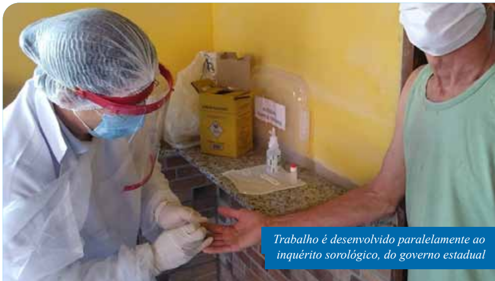
Trabalho é desenvolvido paralelamente ao inquérito sorológico, do governo estadual