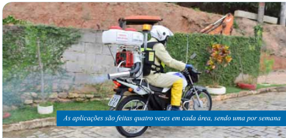
As aplicações são feitas quatro vezes em cada área, sendo uma por semana

Jardim Itapemirim, IBC, Jardim América, São Francisco de Assis, Parque Laranjeiras, Otto Marins, Nova Brasília, Santo Antônio, Alto Eucalipto, Zumbi, Teixeira Leite, Valão, Vila Rica e Maria Ortiz.