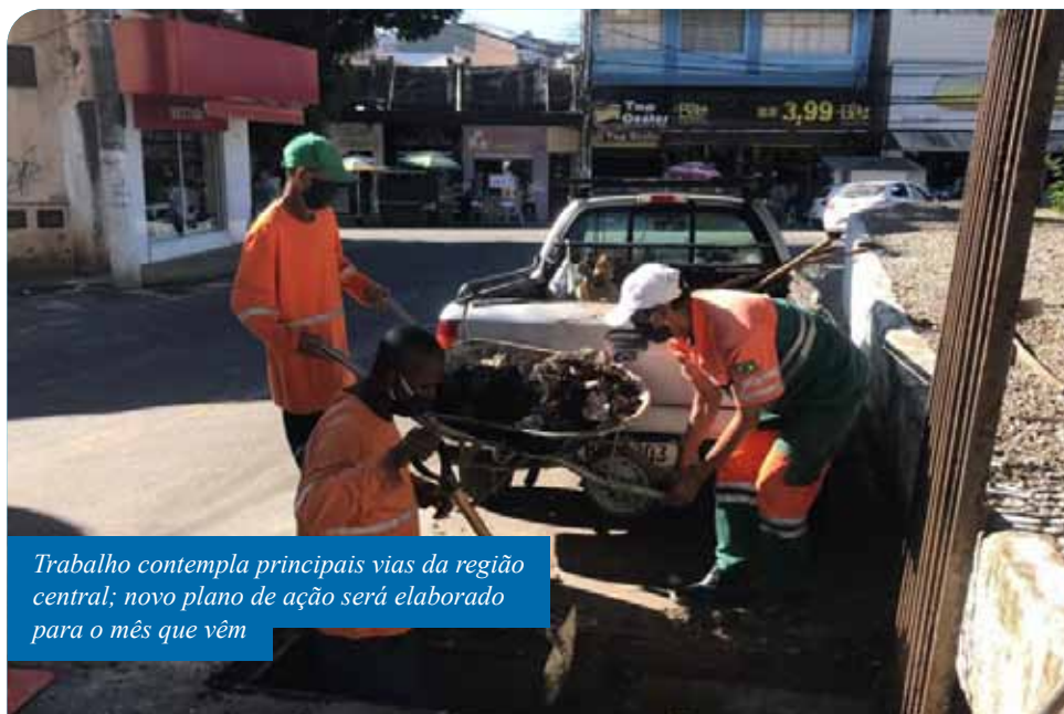
Trabalho contempla principais vias da região central; novo plano de ação será elaborado para o mês que vem

Atualmente, a Secretaria Municipal de Obras também realiza obras de drenagem em uma área do Coronel Borges que contempla o complexo