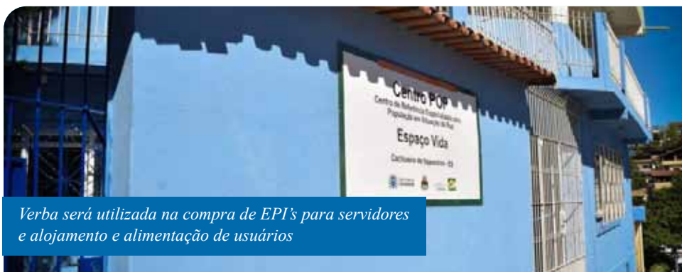
Verba será utilizada na compra de EPI's para servidores e alojamento e alimentação de usuários

Também haverá R$ 35.880 para aquisição de alimentos para pessoas idosas e com deficiências