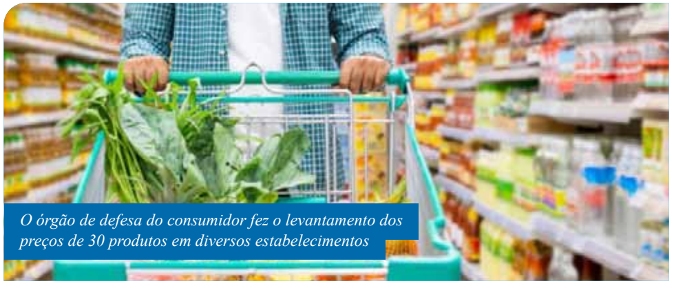
O órgão de defesa do consumidor fez o levantamento dos preços de 30 produtos em diversos estabelecimentos

Itens de limpeza e higiene pessoal também apresentaram variação. O sabão em pó (pacote de 1kg), pode ser encontrado com valores entre R$ 3,89 a R$ 6,99, 79% de diferença. O valor do desodorante spray (90/100ml), por sua vez, alterna em 119,16%, sendo comercializado por R$ 3,60 até R$ 7,89.